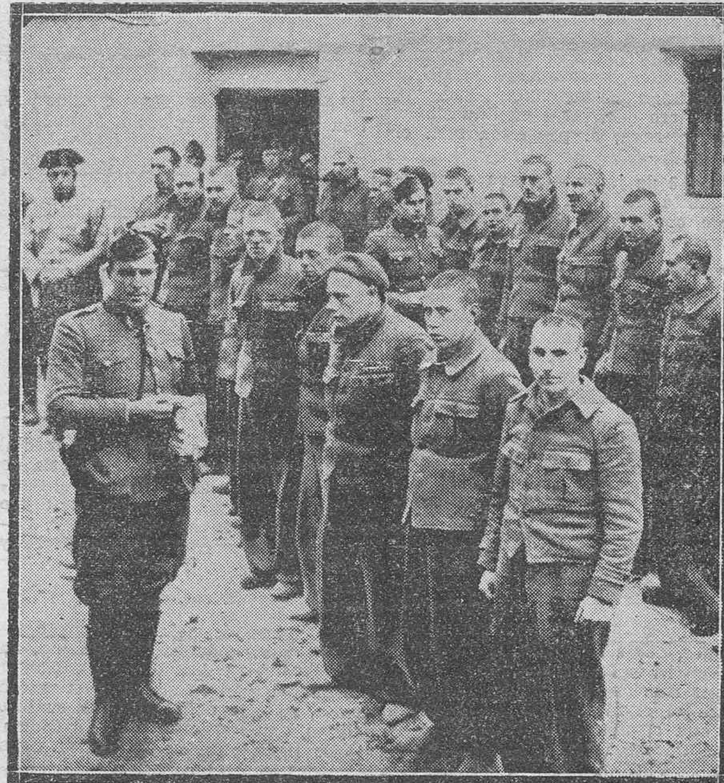
Un grupo de prisioneros extranjeros pertenecientes a las brigadas internacionales, que han sido capturados por las tropas nacionalistas. Muchos de estos prisioneros han sido puestos en libertad por el general Franco, lo que ha causado excelente impresión en el Extranjero, según dicen las noticias de ayer.

Por otra parte, la suspensión de las hostilidades en España no presenta, según el punto de vista alemán, más que una importancia secundaria. El interés de Hitler, y en este punto es invariable, es que España sea para los españoles.