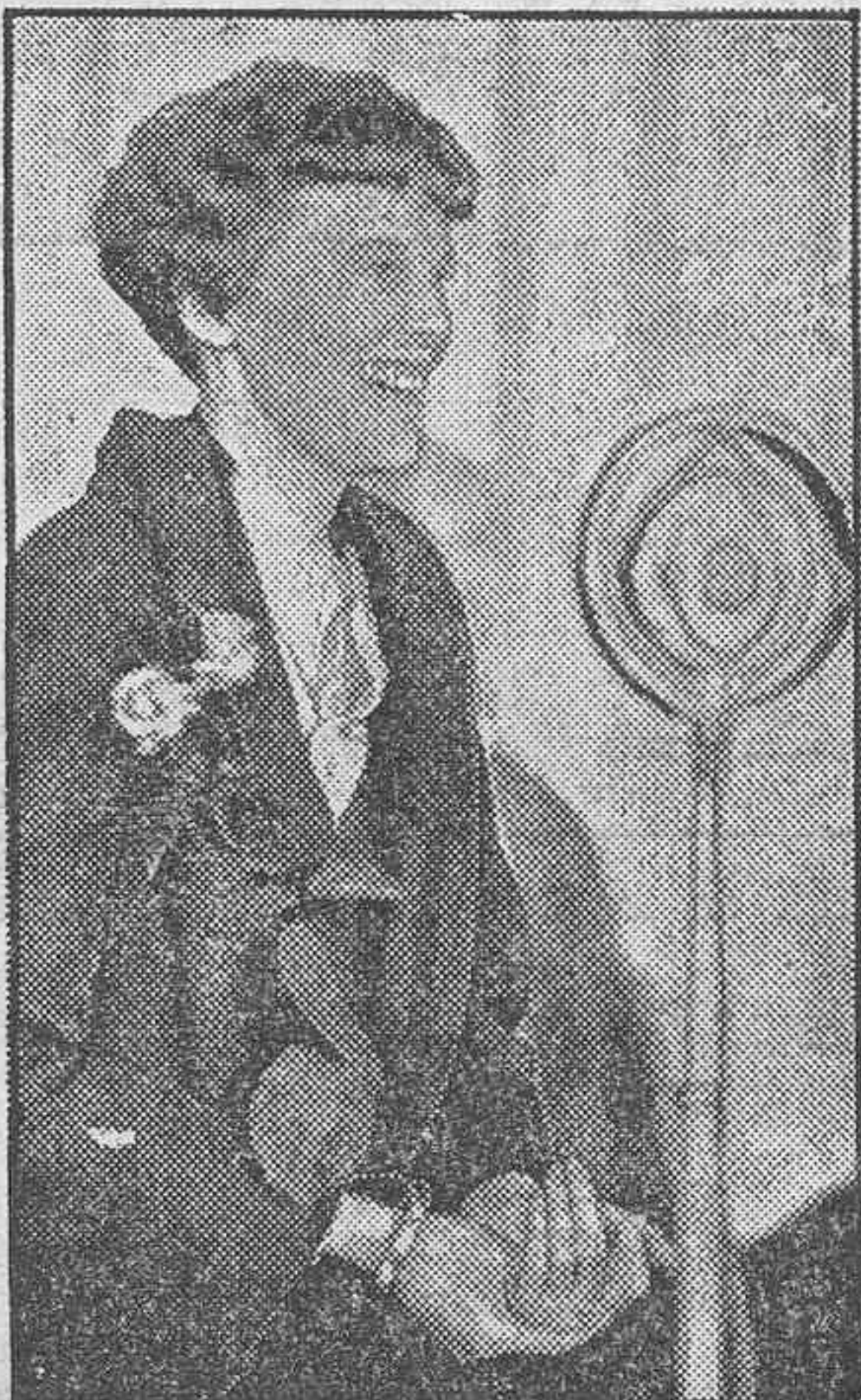
La célebre aviadora americana, miss Amelia Earhart, que va a emprender un vuelo alrededor del mundo, y que ha retrasado su viaje durante 24 horas a causa de los temporales desencadenados en Honolulu, sitio de partida.—El doctor Hugo Eckener, antiguo comandante del "Condé Zeppelin", que ha marchado a Londres para recibir la "medalla de oro" de la Real Sociedad Británica de Aeronáutica, por sus valiosas realizaciones en el campo de la navegación aérea.

Santa Cruz de Tenerife, 13 de marzo de 1937.