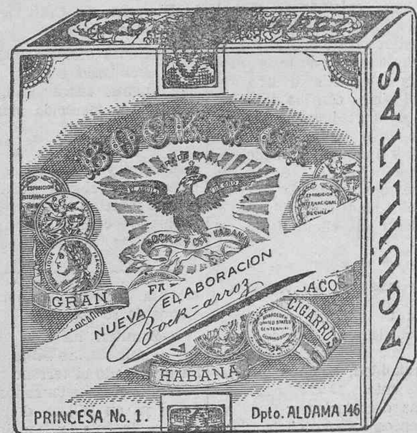
ELABORADO CON LAS MEJORES RAMAS DE CUBA

Habiendo llegado el Inspector que visitará las propiedades que se ofrecen en garantía de los préstamos hipotecarios a largo plazo que se soliciten, se avisa a las personas interesadas en esta clase de operaciones, para que vengán a informarse en las oficinas, calle de O'Donnell, número 5, moderno (próximo a la plaza de 25 de Julio).—Teléfono número 138, en Santa Cruz de Tenerife.