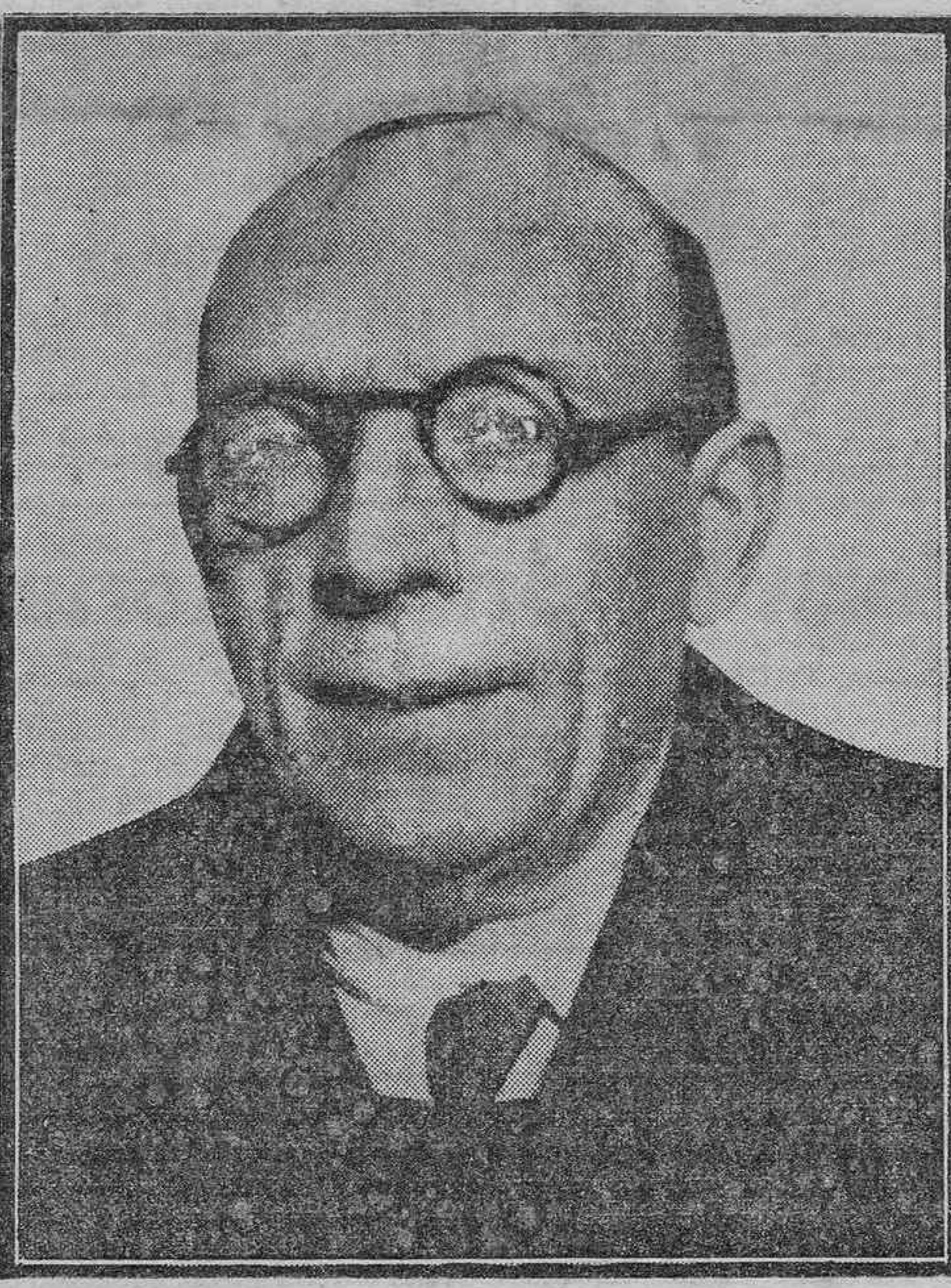
DON RICARDO SAMPER, DIPUTADO POR VALENCIA Y EX-MINISTRO DE INDUSTRIA, QUE HA SIDO ENCARGADO DE LA FORMACION DEL NUEVO GOBIERNO

A las once y media llegó el señor Alba, que celebró una breve entrevista con el señor Alcalá Zamora.