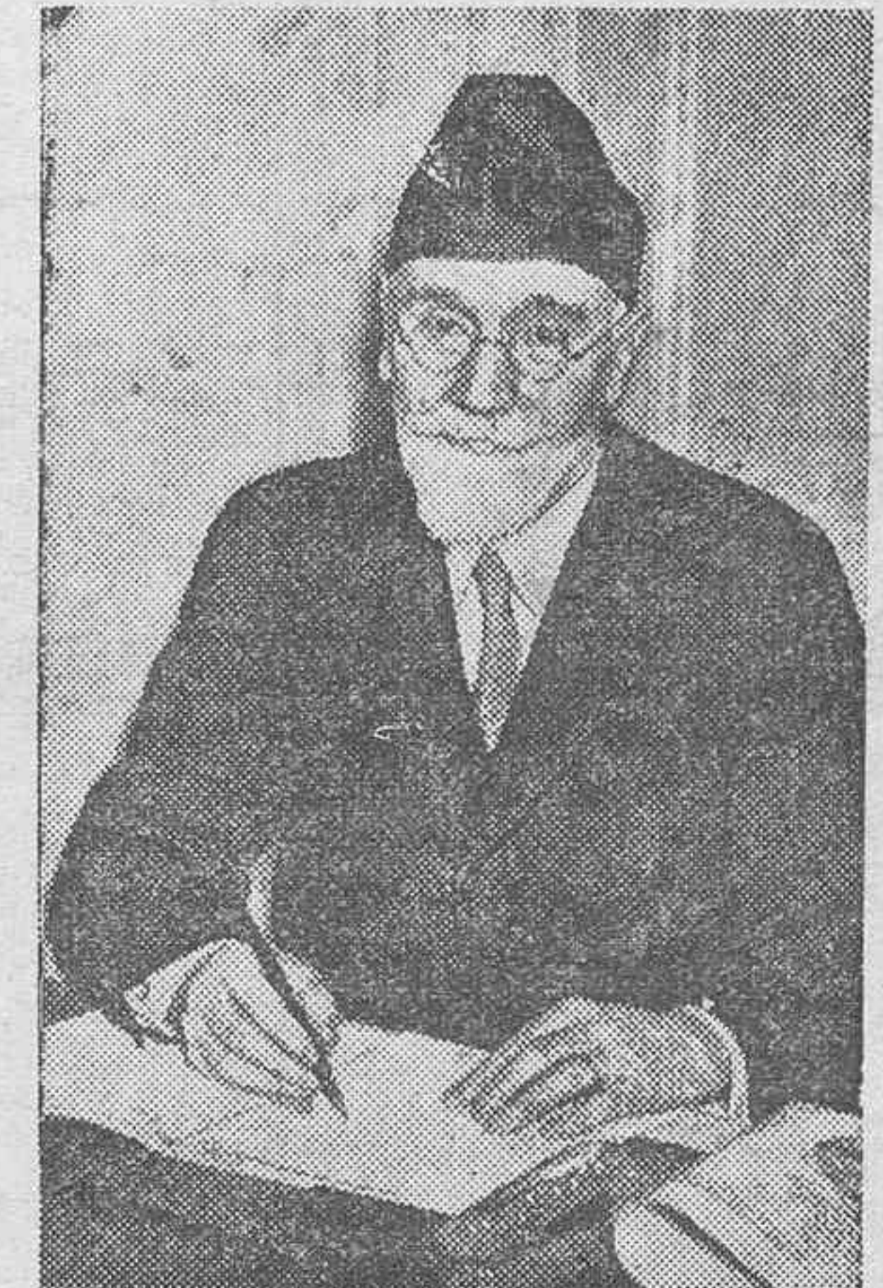
El señor Venizelos, famoso político griego, director del movimiento revolucionario contra el Gobierno de Atenas.