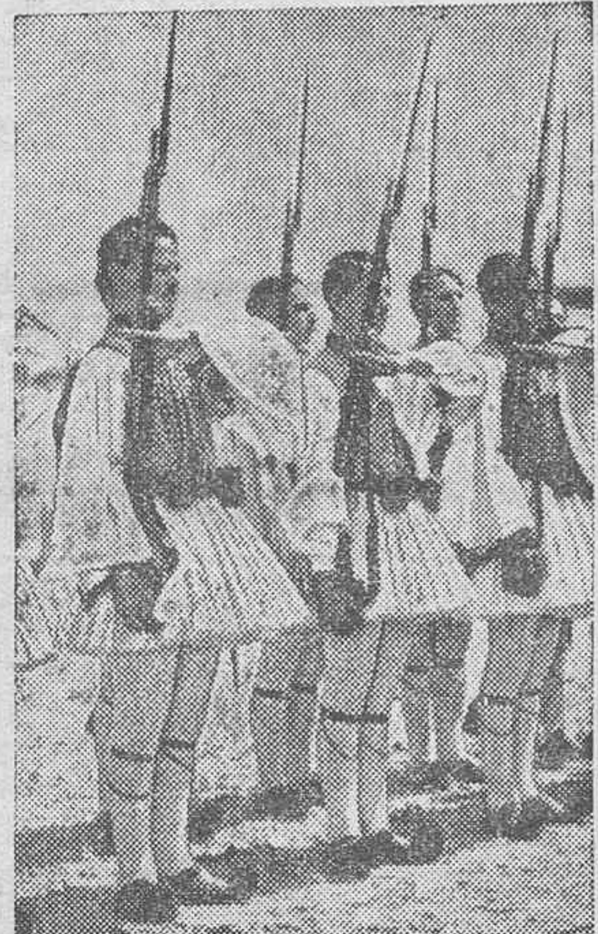
Soldados de la llamada guardia nacional griega, que han permanecido adictos al Gobierno durante la actual revolución.