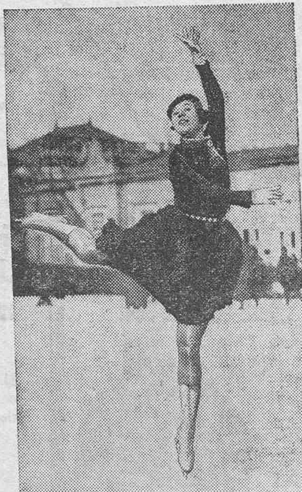
La temporada de invierno en St. Moritz ofrece, como en años anteriores, el atractivo de las bellas deportistas internacionales que lucen sus habilidades artísticas sobre las pistas heladas.