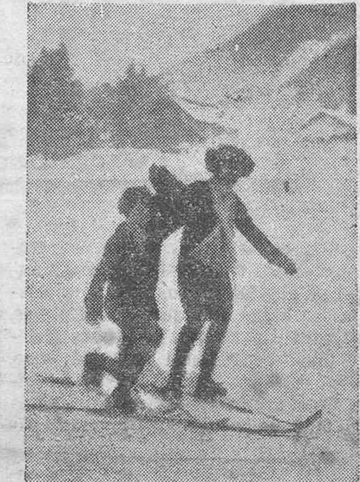
...Y los niños alternan la construcción de monigotes con sus primeros peninos sobre los traidores skis.