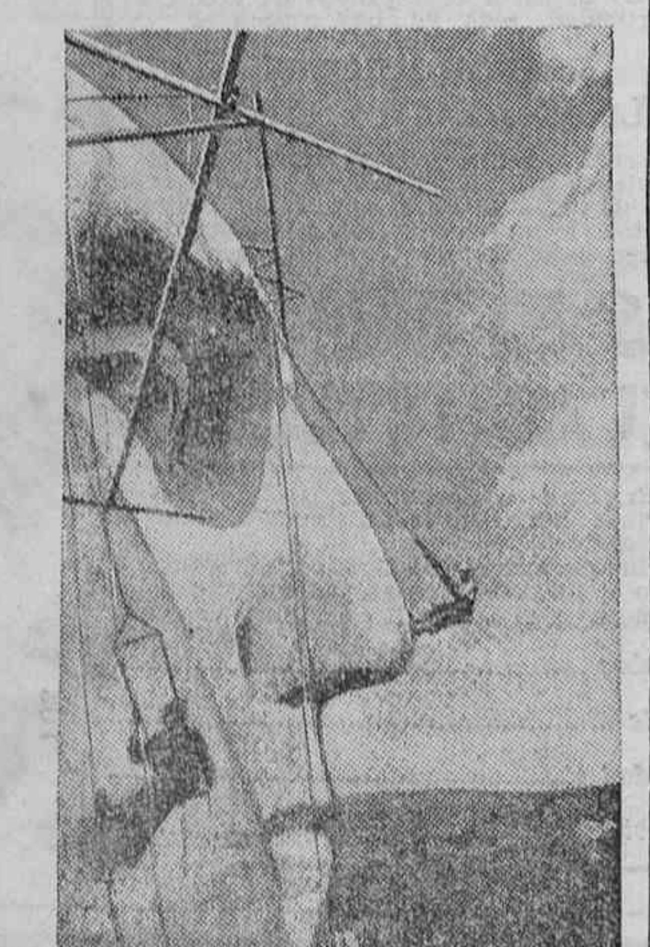
El escultor americano Gutzon Borglum trabaja actualmente en el monumento a la memoria de George Washington. La foto muestra el perfil del gran presidente norteamericano. Para darse cuenta de las proporciones de este monumento basta mirar al artista en un momento de su trabajo y el andamiaje que ha sido necesario construir para llevar a cabo la difícil labor

Que una vez adquirida esta sólida base pedagógica moderna, haremos un proyecto de Escuela Canaria según lo exigen las condiciones naturales y dentro de los límites de las leyes orgánicas del Estado; entregándose a las autoridades provinciales para su inmediata aprobación; prestándonos a hacer divulgación por un Consejo de conferencias, además de ser quienes lo pondremos en práctica en las escuelas que el Estado tenga a bien determinarnos.