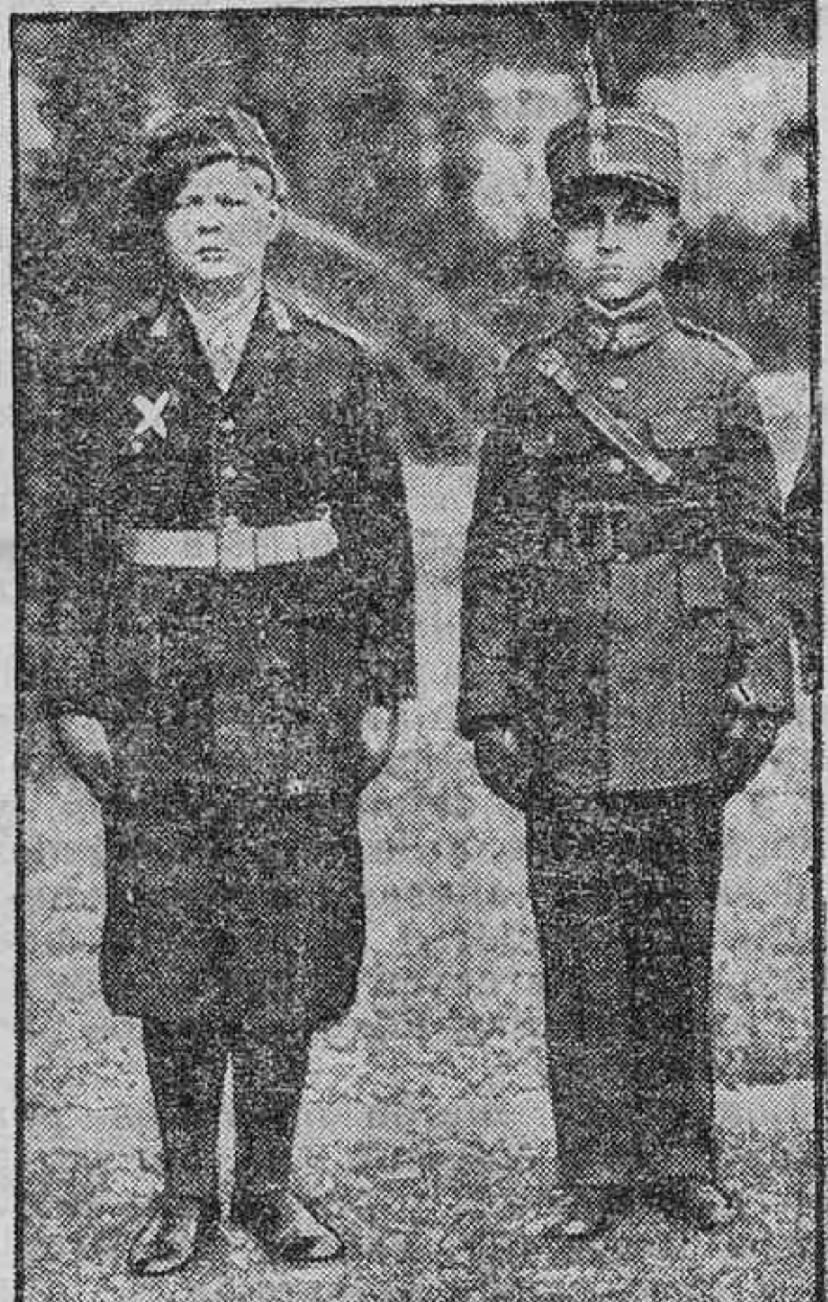
El príncipe Miguel de Rumanía (x)

Cuando la princesa Elena de Grecia, esposa del Rey Carlos de Rumanía, se despidió de su hijo el príncipe Miguel, se despidió de su hijo el príncipe Miguel.