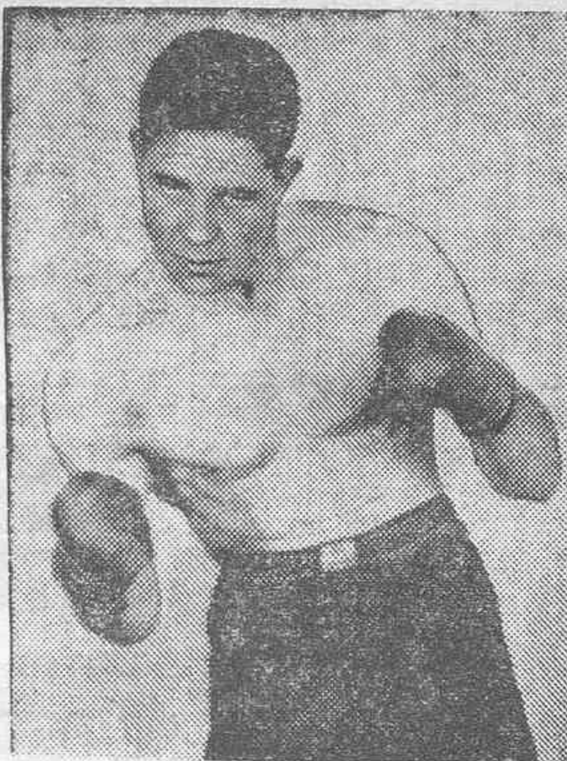
Las "fotos" representan a Baer, Schmeling y Carnera.