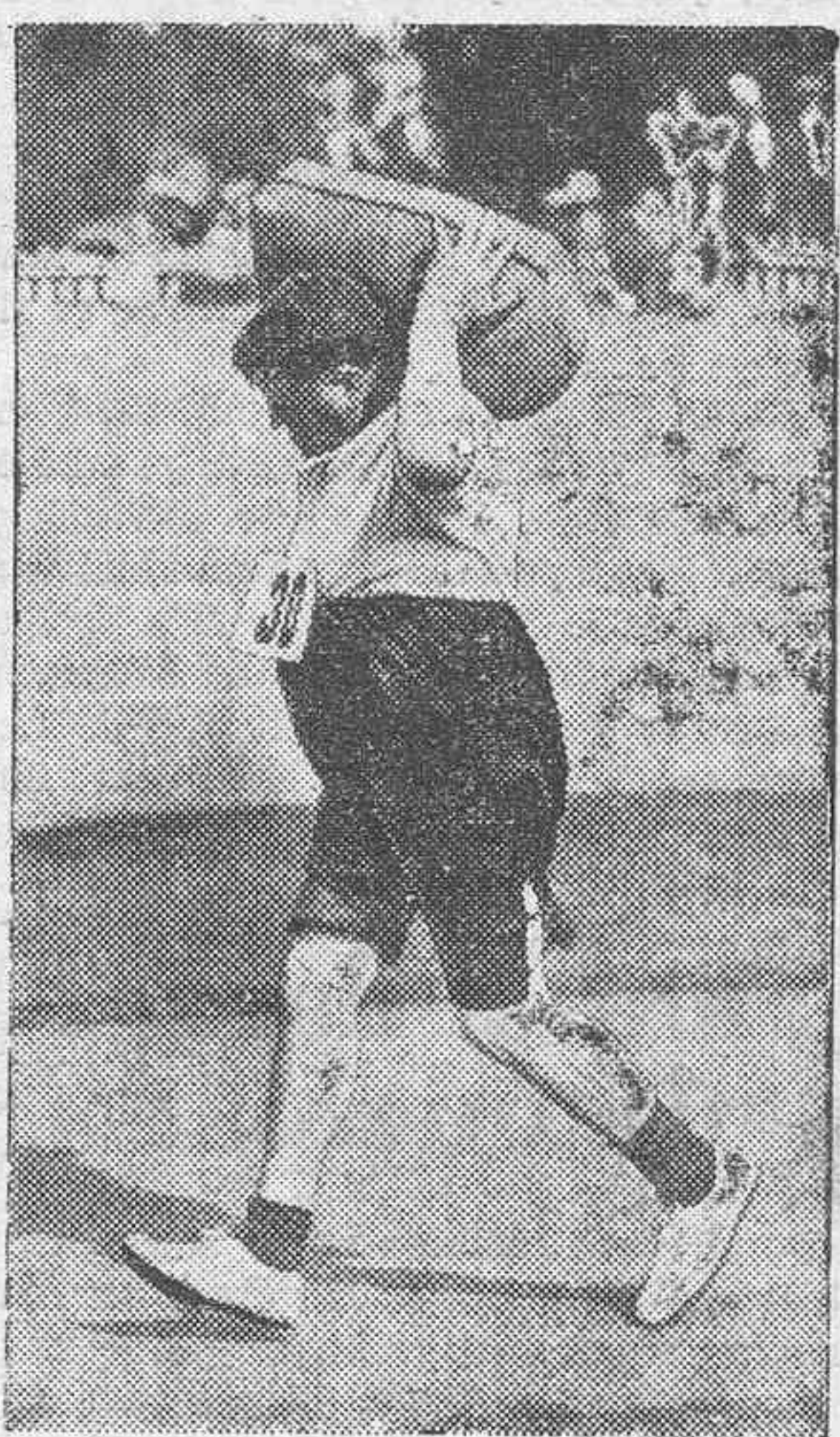
Un detalle de las carreras a pie celebradas recientemente en Londres. Los corredores han hecho el recorrido sosteniendo en sus espaldas un pesado saco de arena.

LOS MEJORES RELOJES el mayor surtido, los más baratos y de mayor garantía, se encuentran siempre en la acreditada Joyería y Relojería LA ESTRELLA, Clavel, 14. En objetos para regalos y carteras para señora y caballero, gran surtido.