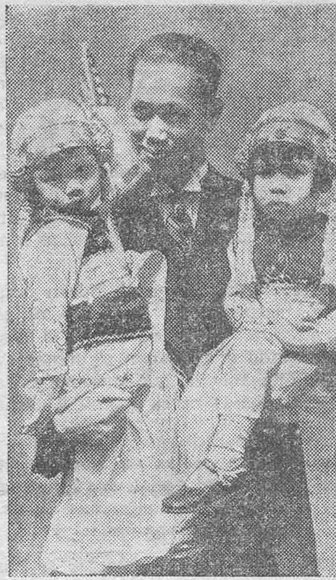
El general chino Tsai Ting Kai, defensor de Shang-Hai contra las tropas japonesas, fotografiado durante su estancia en New York, con dos pequeñas admiradoras, en una casa del Barrio Chino.