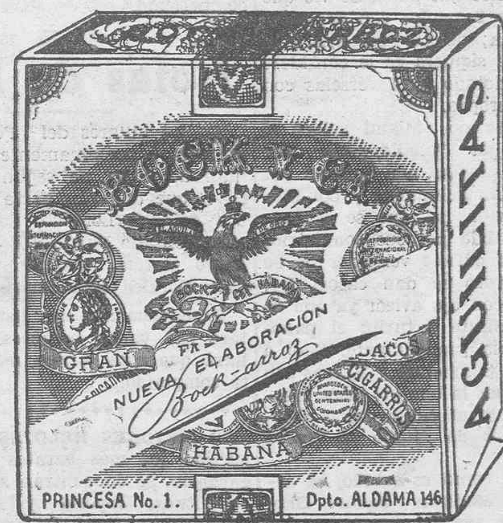
ELABORADO CON LAS MEJORES RAMAS DE CUBA

Ha quedado nuevamente abierto este acreditado hotel después de importantes reformas en el servicio. Habitaciones con agua corriente. Excelente cocina a precios módicos. Té de tarde a pesetas 1'75. Comidas a pesetas 4. Bebidas de todas clases al bielo. Para la temporada veraniega, precios convencionales. Se ruega separar las habitaciones con antelación.—LA DIRECCION.