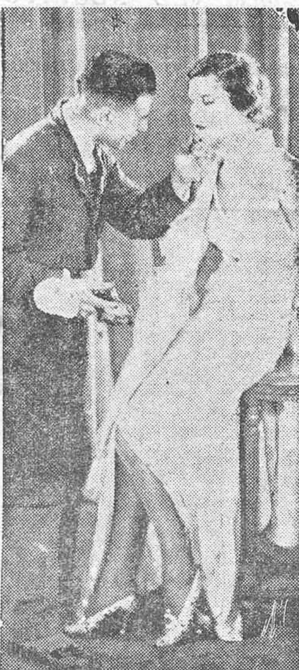
CONCURSOS DE BELLEZA. La operación de maquillaje de una «Miss».