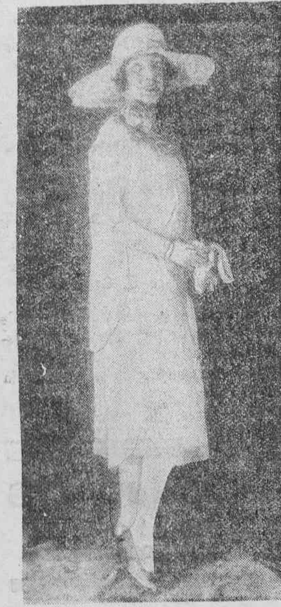
PROCESO RUIDOSO.—La bella y famosa artista Mme. Huguette Duflos, que ha sido denunciada por la Comedia Francesa ante la primera Cámara del Tribunal Civil, por haber roto el contrato que la ligaba a la Casa de Mollière. Huguette Duflos ha sido condenada, según los telegramas de ayer, al pago de 150.000 francos a la empresa de la Comedia.

Salta a la vista el aislamiento de pueblos como Granadilla, San Miguel, Vilaflor, Arona, Adeje, Guía,