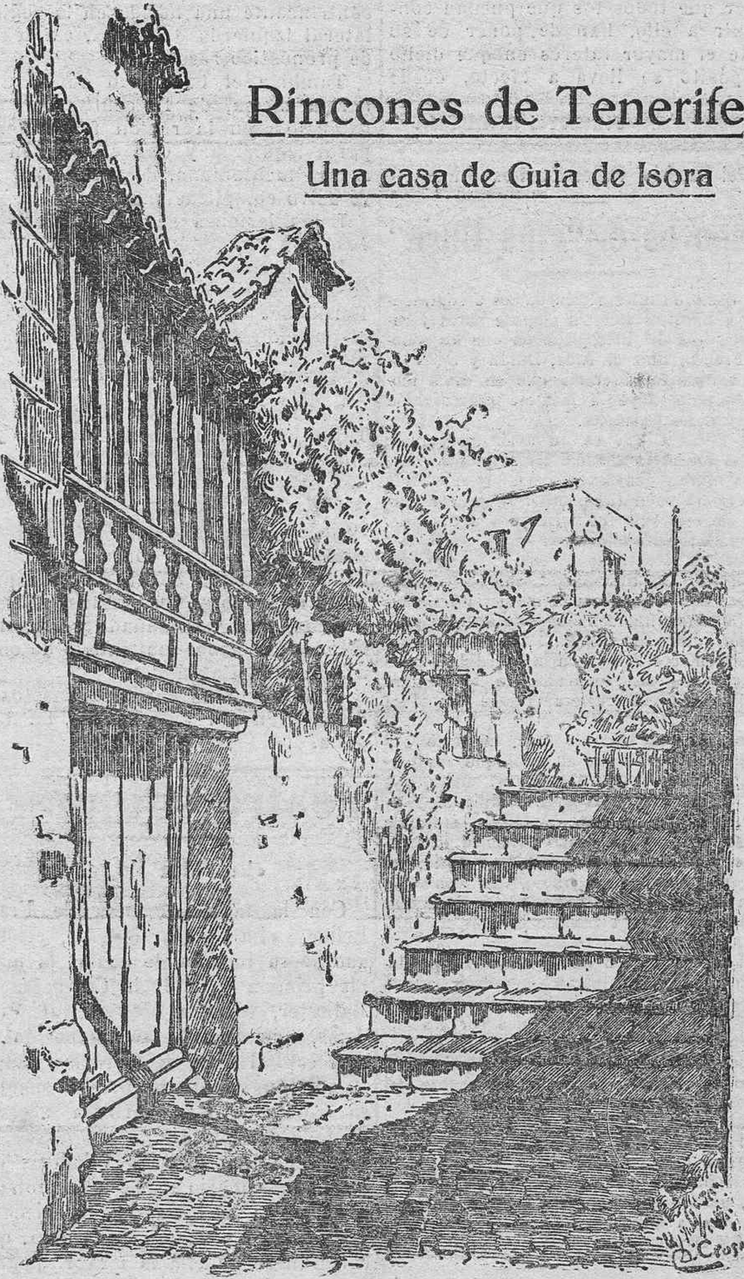
Apunte tomado del natural por Diego Crosa

Por otra parte, el "Alsedo", manteniendo una alta velocidad durante muchas horas, ha demostrado la inmejorable calidad de la construcción naval española, y el hecho honra a la Constructora Naval, de cuyos astilleros de Cartagena es producto el destróyer.