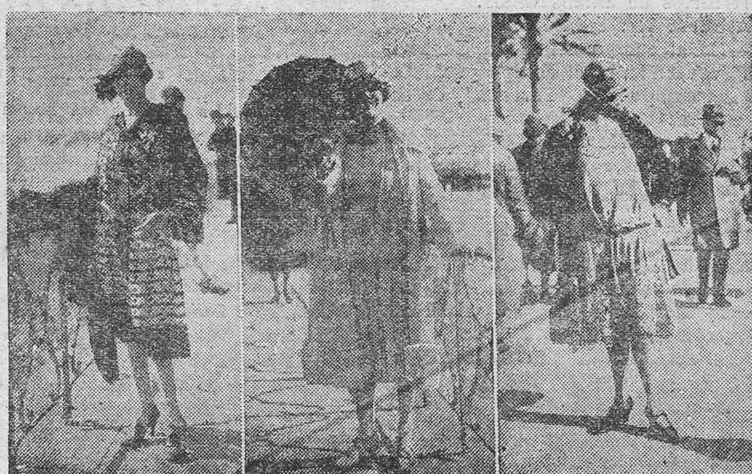
LOS ULTIMOS MODELOS DE LA ESTACION.—He aquí algunas interesantes siluetas que han dado la nota de mayor elegancia en la actual temporada en la Costa Azul