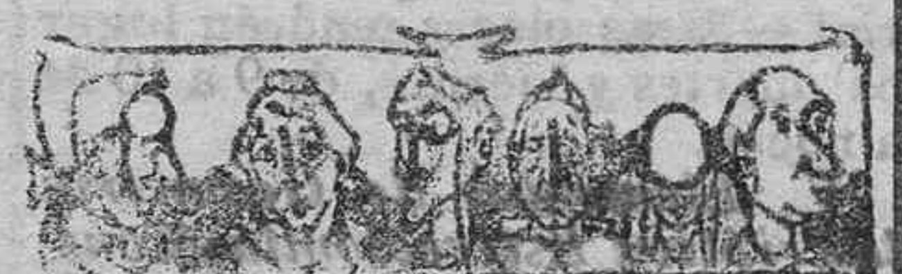
DE UNA GRATIFICACION

Parecidas rebajas se han introducido en los fletes de los puertos del Atlántico y del golfo a los puertos de la India.