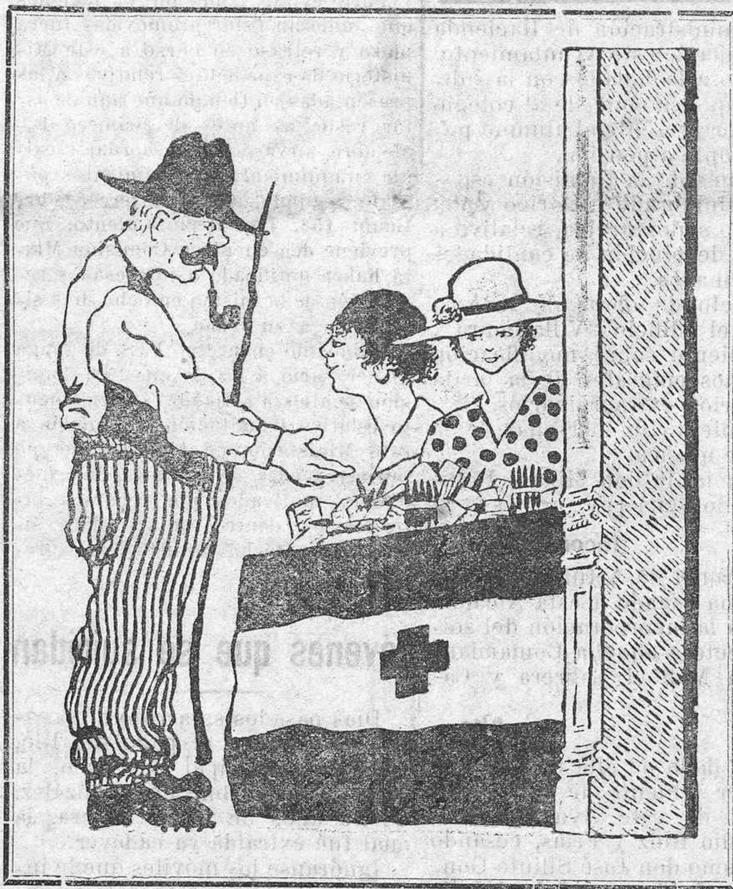
EN EL VESTIBULO DE "LA PRENSA" —Señorita, ¿me quíe vender un mazo de virginio?...—