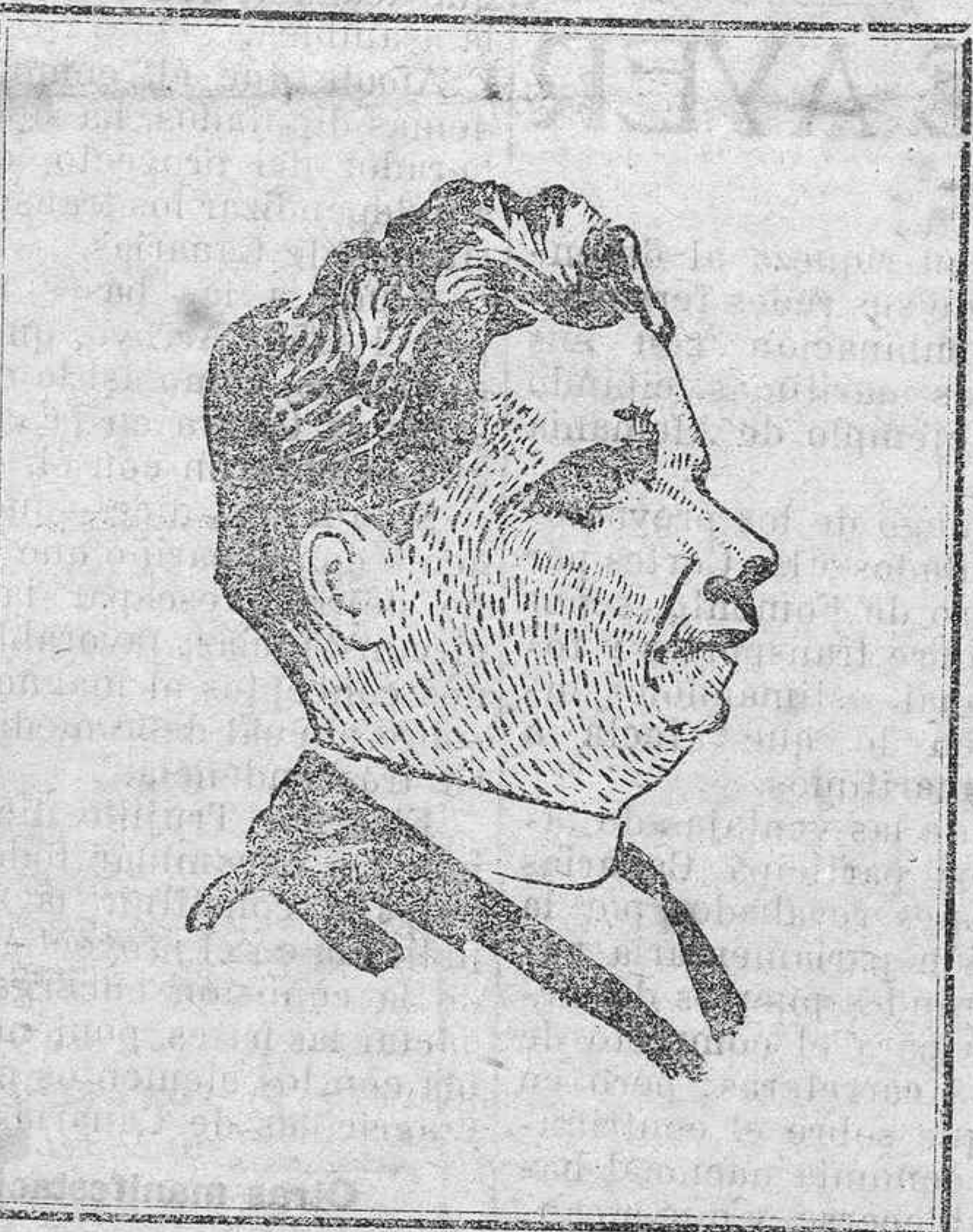
TOMAS MORALES. —Apunte por Davó

(Una de las últimas poesías que escribió el malogrado poeta Tomás Morales)