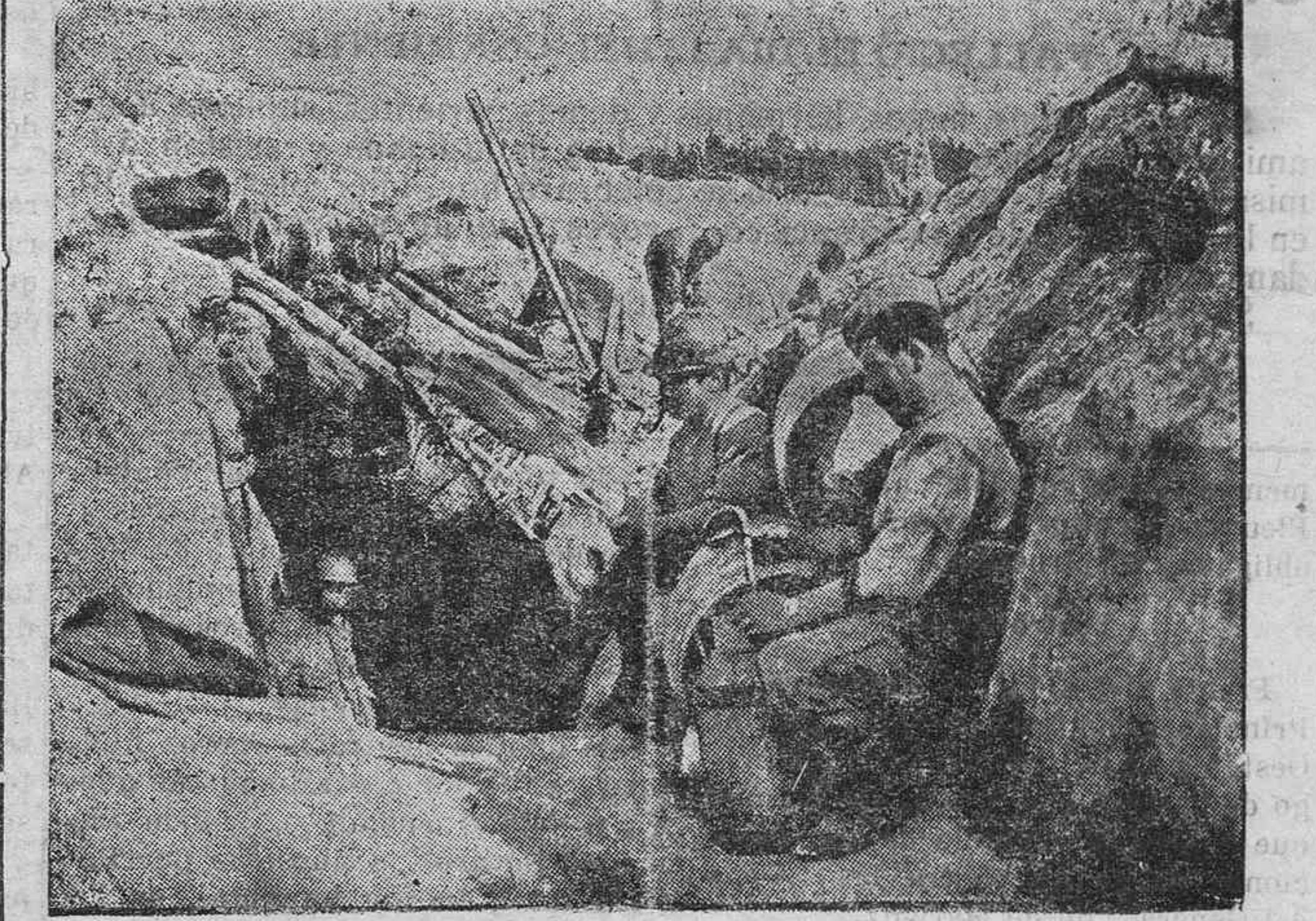
LA VIDA EN LAS TRINCHERAS