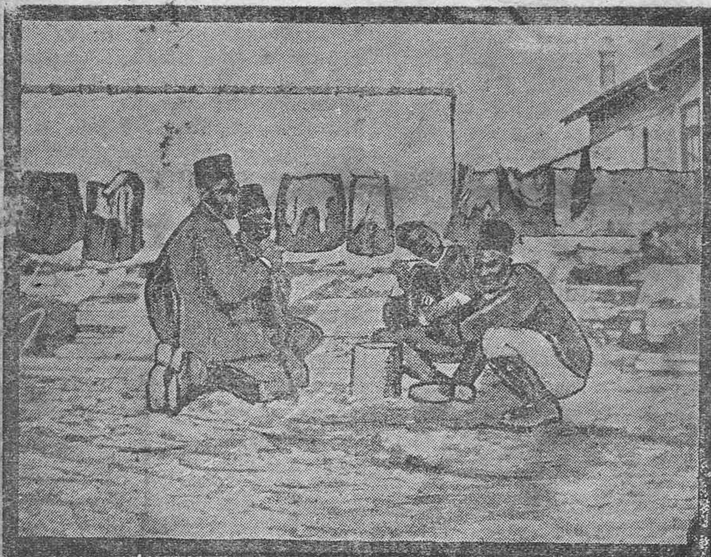
Soldados senegaleses en un descanso durante las últimas batallas