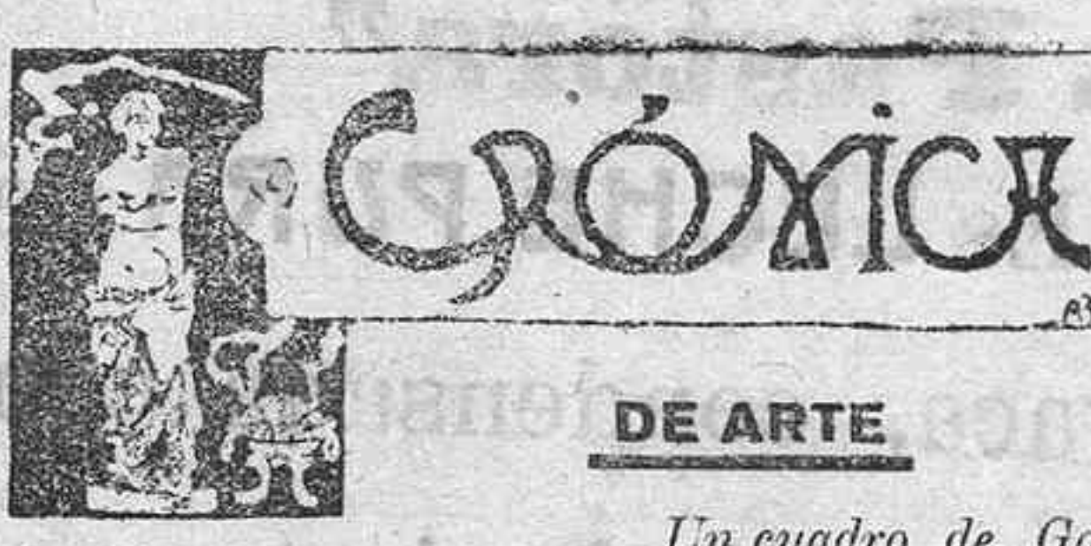
Un cuadro de Goya en el Ayuntamiento de La Laguna.

Cítese á otra Asamblea para este asunto tratar, que el pueblo lo que desea es poderse alimentar.