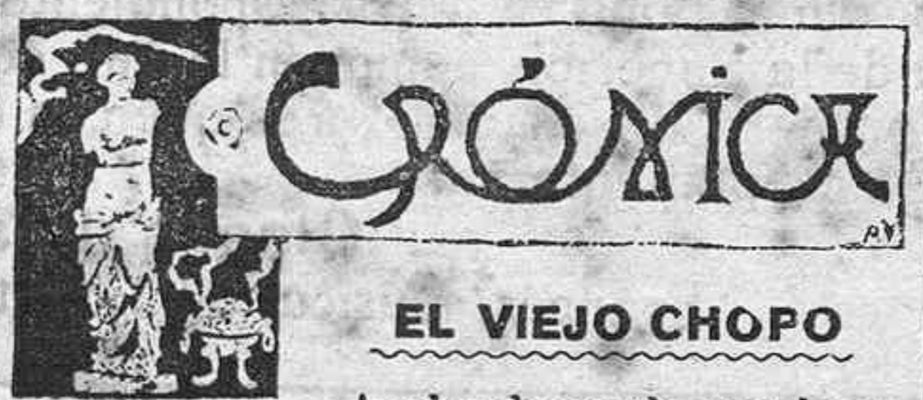
EL VIEJO CHOPO

Y, sin embargo, ya lo ven nuestros lectores: silencio, indiferentismo, despreocupación por todas partes.