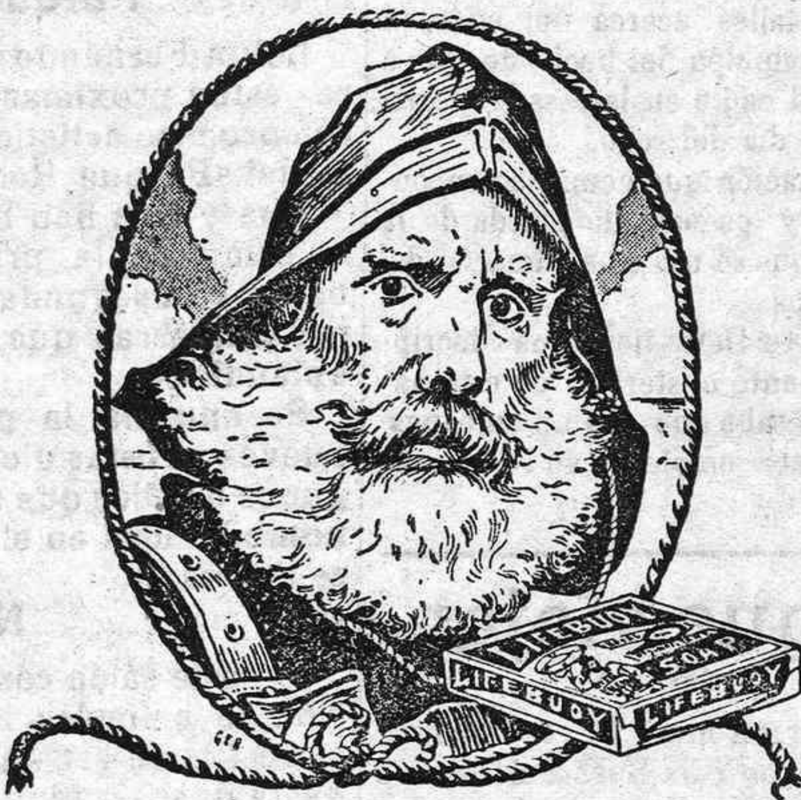
UN PRESERVADOR DE LA VIDA!