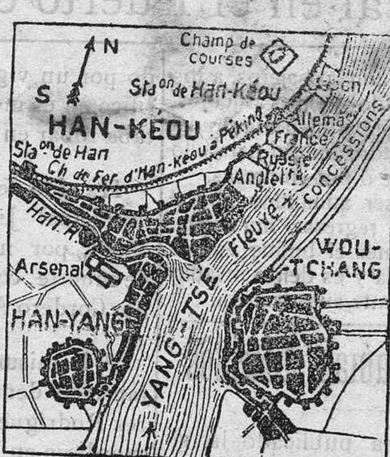
Gráfico de las tres provincias en que estalló la revolución y en que primero fué proclamada la República.

Los mandchúes siguen negándose á libertad de conciencia más amara en la abdicación del trono y en el triunfo de los republicanos chinos. La cuestión de la futura capital causa una gran agitación. Los delegados de Wou-Chang y de Nankin ponen de manifiesto el derecho que tienen á la capital, sin llegar á un acuerdo. La federación de príncipes de la Mongolia entera, que comprende la Mongolia entera, después de unos mítines entre generales, príncipes y diputados, ha proclamado á Yuan Shi-Kai como