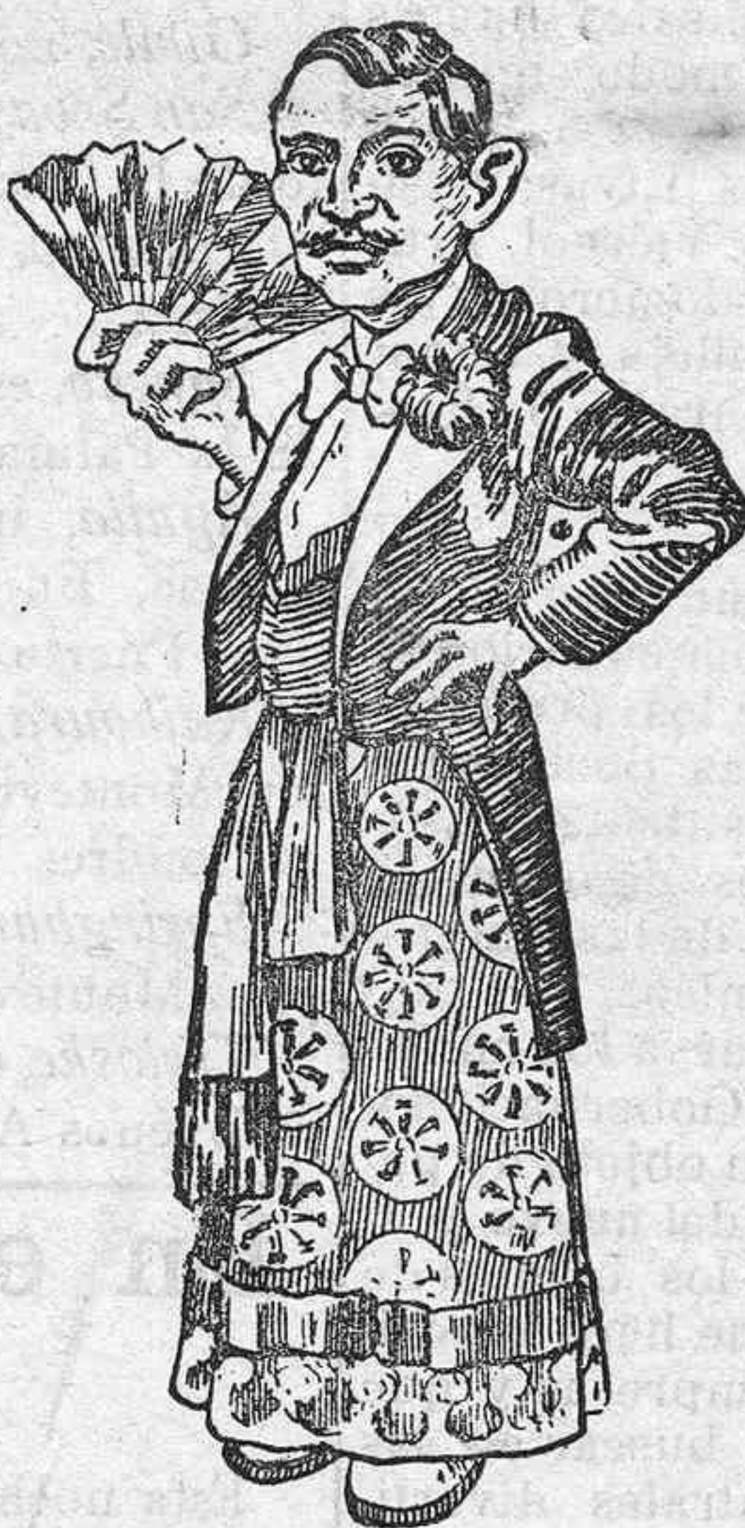
El Dr. Sun-Yat-Sen, presidente de la República china. (Caricatura de «Caras y Caretas».)

El elegido para presidente de la República china, Dr. Sun-Yat-Sen, cuya caricatura publicamos hoy tomada de la revista Caras y Caretas, ha inspeccionado ya oficialmente los buques de guerra anclados en Yan-Tse-Kiang. Tchang-io-Tang mismo fué hecho prisionero y despelado. Los selvas se repartieron su corona, sus higados y su cerebro. En fin, se cuentan escenas de horrible salvajismo. Las calles de la villa están llenas de sangre y las cabezas de los muertos están suspendidas de los árboles. Los cristianos han llevado también su parte, habiendo sido muertos más de veinte, y hay cinco ó seis oratorios destruidos. Créese que dentro de unos días se publicará un importantísimo edicto imperial en el que no tan sólo se anunciará la abdicación de los emperadores, sino que en el mismo se proclamará el establecimiento del Gobierno republicano, cuyo presidente elegirá en seguida el pueblo, con lo cual se logrará que la República pueda ser mirada como una verdadera República constitucional que sucederá legítimamente á la monarquía por la voluntad misma del emperador. También parece probable que sean debidamente atendidas las pretensiones de Yuan-Shi-Kay á la presidencia de la República.