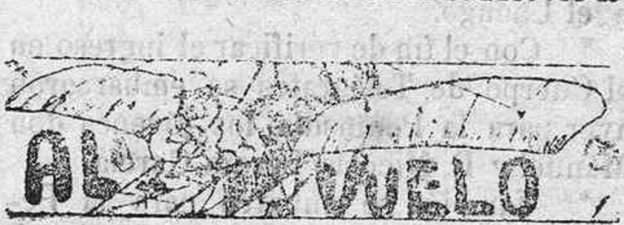
Pericances del oficio