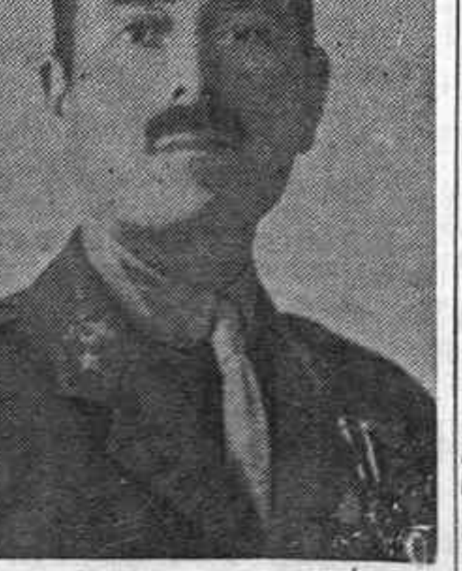
El sanguinario y traidor Millán Astray

VALENCIA, 23.— Como es sabido, Unamuno fué depuesto del cargo de rector de la Universidad de Salamanca, en un acto en que Millán Astray dió el grito fascista de «muera la inteligencia». No extrañaba que Franco no premiara este nuevo gesto de su antiguo jefe. «El Correo de Andalucía» publica ya una foto de Millán Astray con el siguiente pie: «El fundador de la Legión y hermano mayor de la Cofradía de los estudiantes».