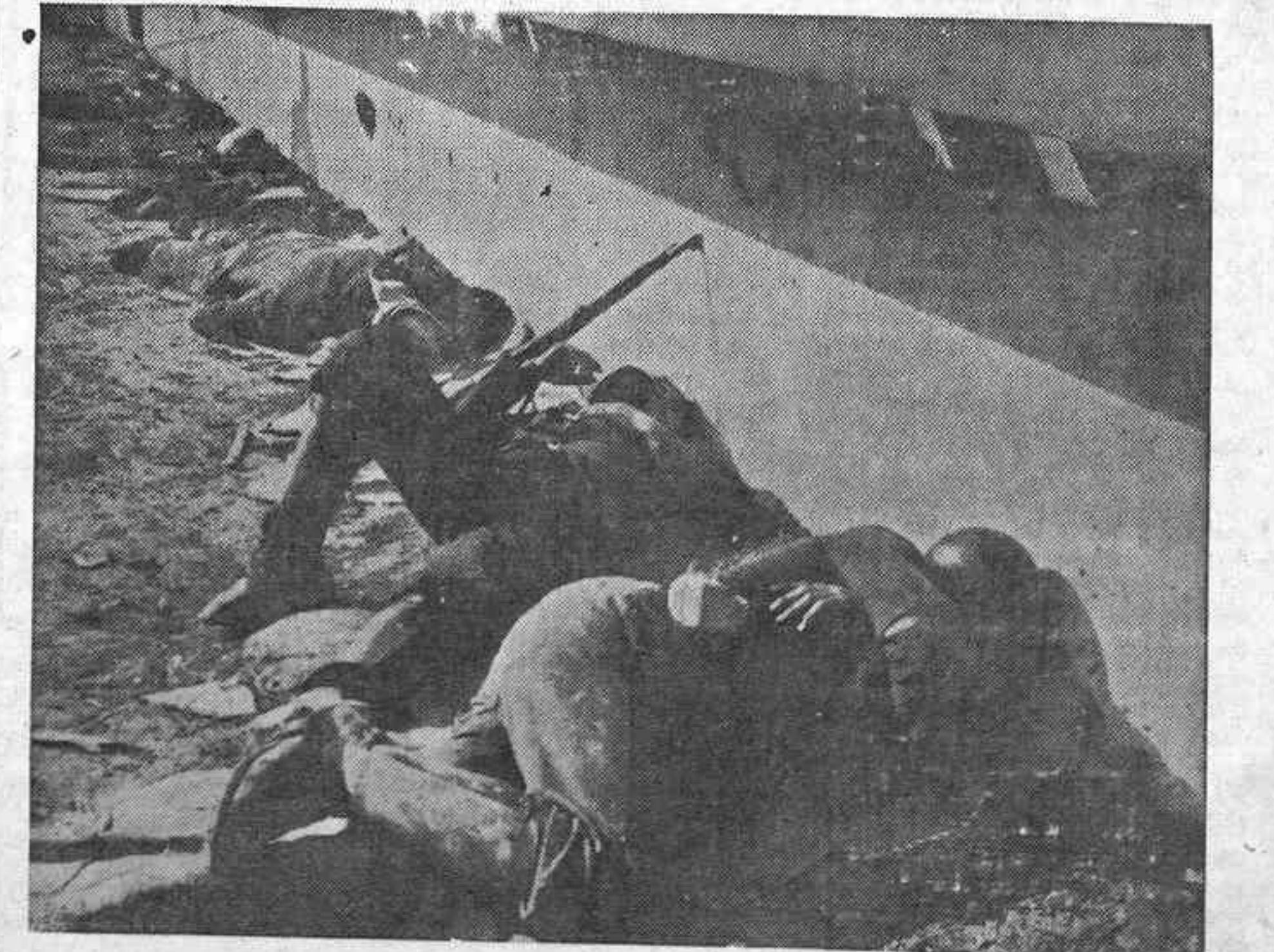
Cualquier sitio es bueno para dormir. Lo importante es dormir vigilando. Con un ojo abierto y con el fusil a punto...

Convalidación de decretos del Gobierno de la República