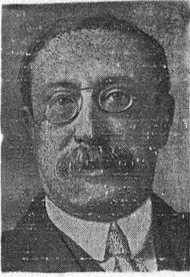
El jefe del Gobierno francés, León Blum

LONDRES, 18.—Hoy a mediodía terminó la huelga general declarada en París con motivo de los sucesos de Clichy. Dado el orden con que se resolvió el conflicto y las facilidades dadas por las organizaciones obreras, se cree que no habrá las consecuencias gravísimas que se temieron. Se espera con impaciencia la declaración del Gobierno sobre los sucesos y el señalamiento de los culpables. Hay que alabar la conducta de los obreros que, aconsejados por sus sindicatos, no pusieron el menor obstáculo a la conducta a seguir por el Gobierno Blum, permitiendo así que éste, con la máxima autoridad, busque favorable desenlace a este desgraciado incidente. La paralización en las actividades parisienses fue absoluta, aunque las calles presentaban animadísimo aspecto. Las mujeres en huelga animaban las calles con su presencia, curioseando escaparates y dando la sensación de celebrarse una fiesta. El único incidente registrado tuvo lugar en la Bolsa. Docientos obreros se presentaron en sus locales para obligar al cierre. Ante la resistencia de los corredores, se entabló una corta lucha a la que puso fin la pronta intervención de la gendarmería. El reparto de la leche y la venta de periódicos se hicieron con toda normalidad. Después del mediodía quedaron reanudadas todas las actividades.