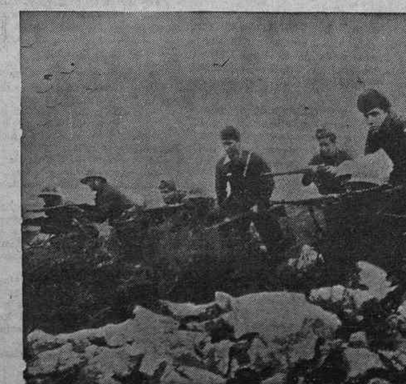
Una descubierta a por el Nareno, frente al Pico del Palanzo

Por el monte de los Pinos hubo también al anochecer algún movimiento poco, pero respondió a un tiroteo intenso de los nuestros que advirtieron algún movimiento en aquella posición. El enemigo contestó en igual forma pero fue una lucha de trincheras sin que nadie abandonase su puesto. Un paqueo algo continuado y nada más.