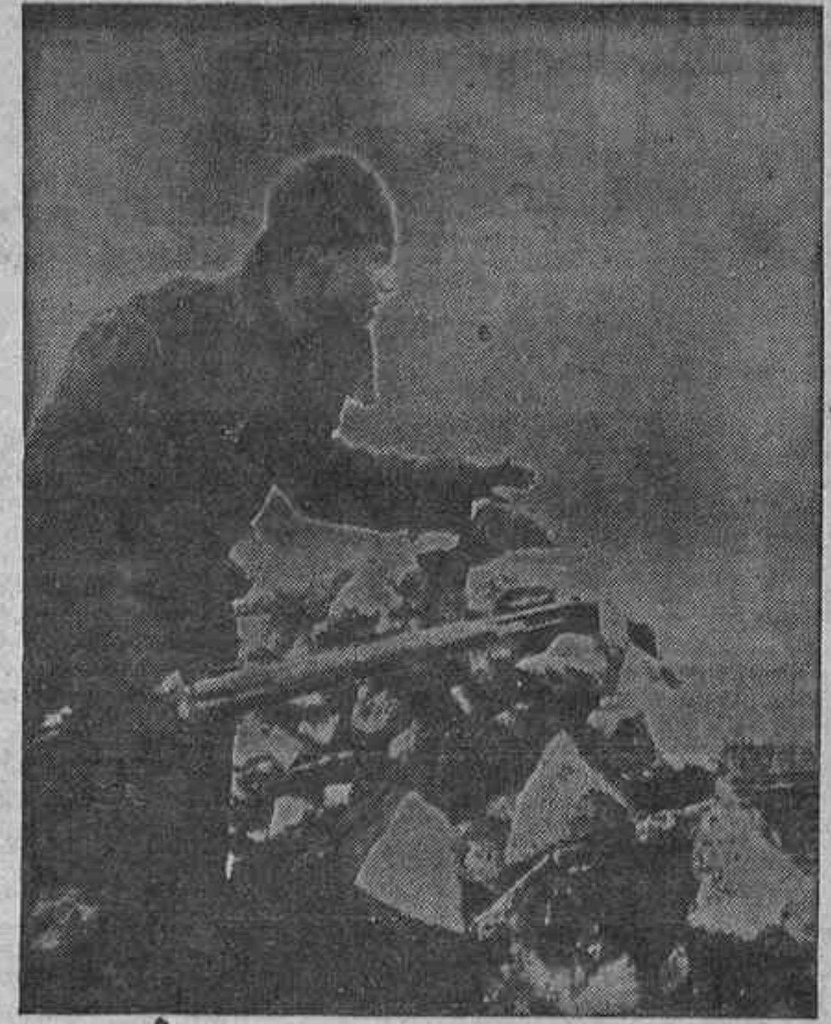
¿Hay novedad? Este luchador antifascista parece haber descubierto algo anormal en terreno rebelde

Y Continúan —El pasado sábado, cuando más terribles eran los trabajos a que estábamos sometidos, nos avisan que el Batallón de Infantería tiene que salir a los frentes de Asturias para acabar de aplastar a los "crojos". Un jefe faccioso nos obliga a formar e inmediatamente un discurso. Nos dice que él ya sabe que entre los que formábamos el batallón los hay "malos" y "buenos". No obstante, esto, no importaba, pues detrás de nosotros irían los fusiles suficientes para ser disparados al menor titubeo. Aunque agregados desde luego no creo que haga