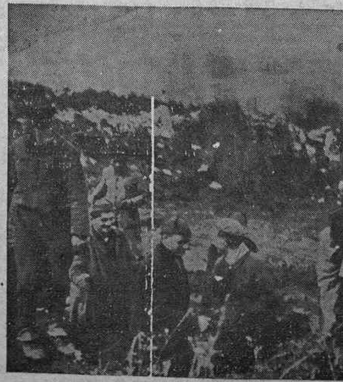
Cuando no hay lucha, los milicianos acondicionan su posición

Ataque rebelde rechazado LONDRES, 8.—Esta mañana, las tropas rebeldes atacaron violentamente por la Ciudad Universitaria y las milicias gubernamentales contruyeron a los facciosos con insuperable energía. Bombardeo aéreo sobre Madrid LONDRES, 8.—Anoche los aviones de los militares insurgentes han vuelto a bombardear Madrid causando heridos en la población civil. Gradual entrada en Oviedo LONDRES, 8.—Se va verificando gradualmente la entrada de las tropas gubernamentales en Oviedo. Dos ataques que intentaron los facciosos para romper el cerco fueron totalmente estériles. MH bajas de los rebeldes LONDRES, 8.—Nos comuni-