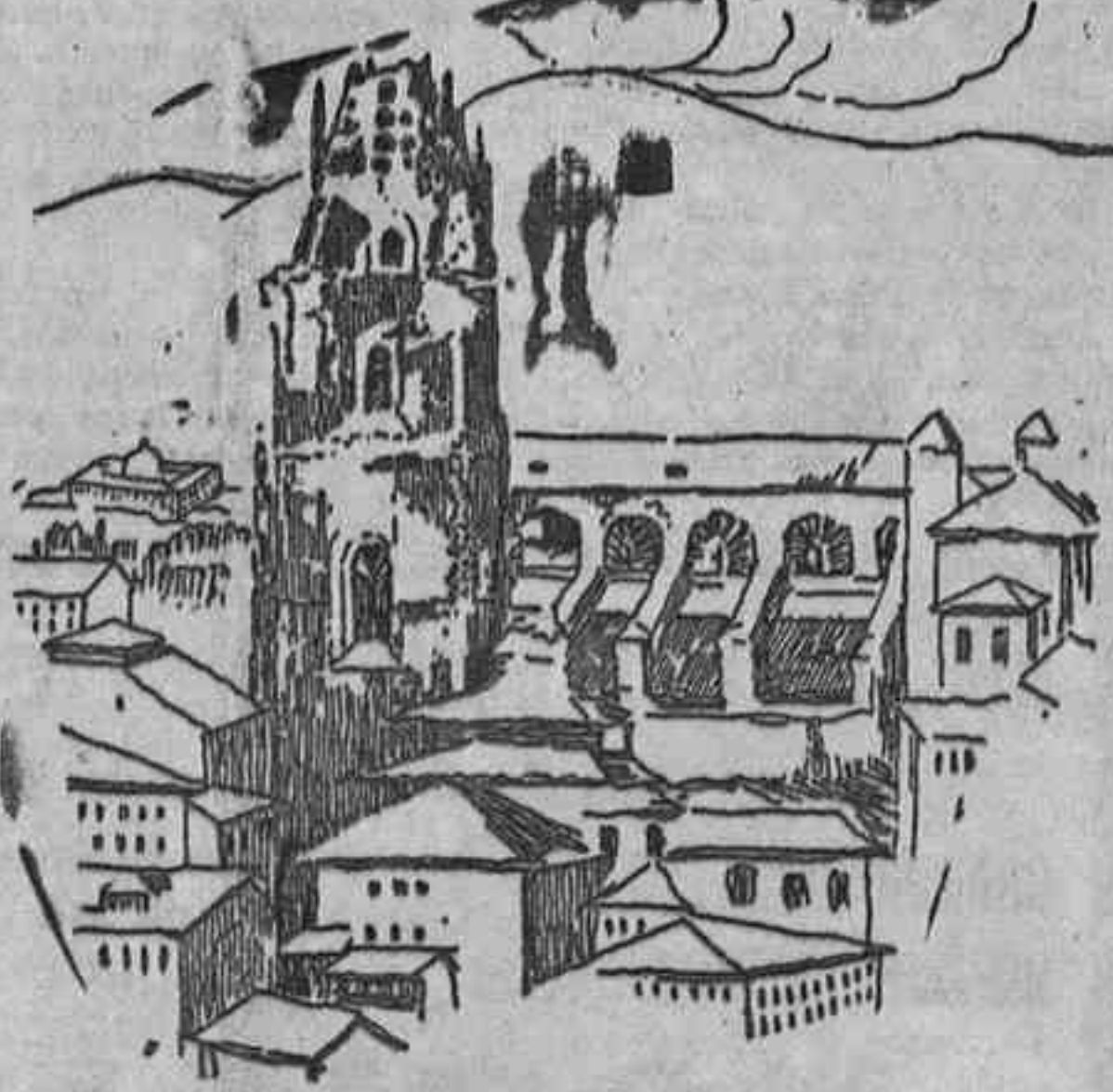
El lápiz de nuestro dibujante ha captado fielmente lo que queda actualmente en pie de la torre de la Catedral oviedense, rido de ametralladoras fascistas (Dibujo de Mariano Moré)

Salvo los inevitables pagueros que ya a nadie llaman la atención y alguna que otra cañonazo de una y otra parte, sin consecuencias apreciadas la calma más absoluta y anodina ha imperado ayer en estos sectores. «Hasta cuando quedará el tiempo tenernos en estas condiciones de ambigüedad, para dejarnos continuar, franca y definitivamente nuestro avance seguro y victorioso?»