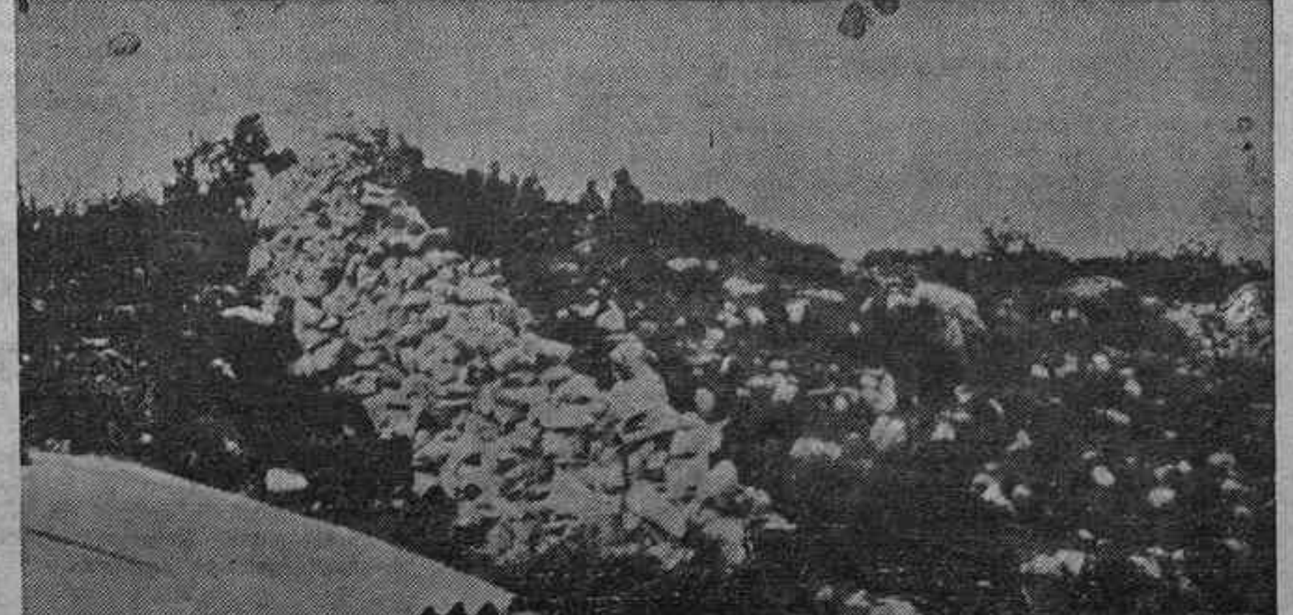
Un parapeto en el Sector de Folgueras

—¿Después? —Después... Formación y marcha, hasta llegar al Escamplero, donde se nos envió a los parapetos. Y, como final, la evasión, llevada a cabo en la forma que sabéis y que pudimos lograr aprovechando un descuido de nuestros vigilantes. Desde luego, sabíamos lo que nos jugábamos en la empresa. Por eso procuramos llevar bastante munición para nuestros fusiles