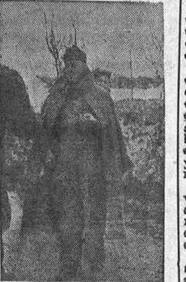
«Portu», un faista portugués cien por cien