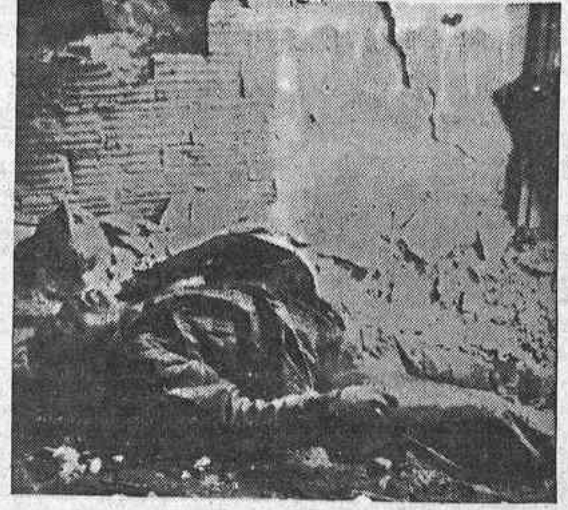
El cadáver de un fascista. A su vera un casco italiano

Los milicianos "ya saben" cómo han de efectuar el avance hacia el centro de la capital