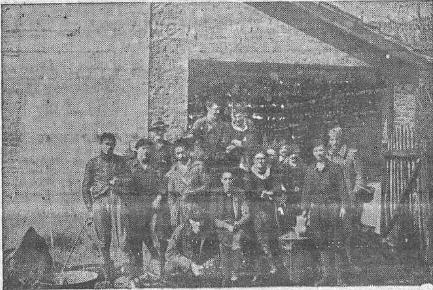
Milicianos del Batallón de Celes to