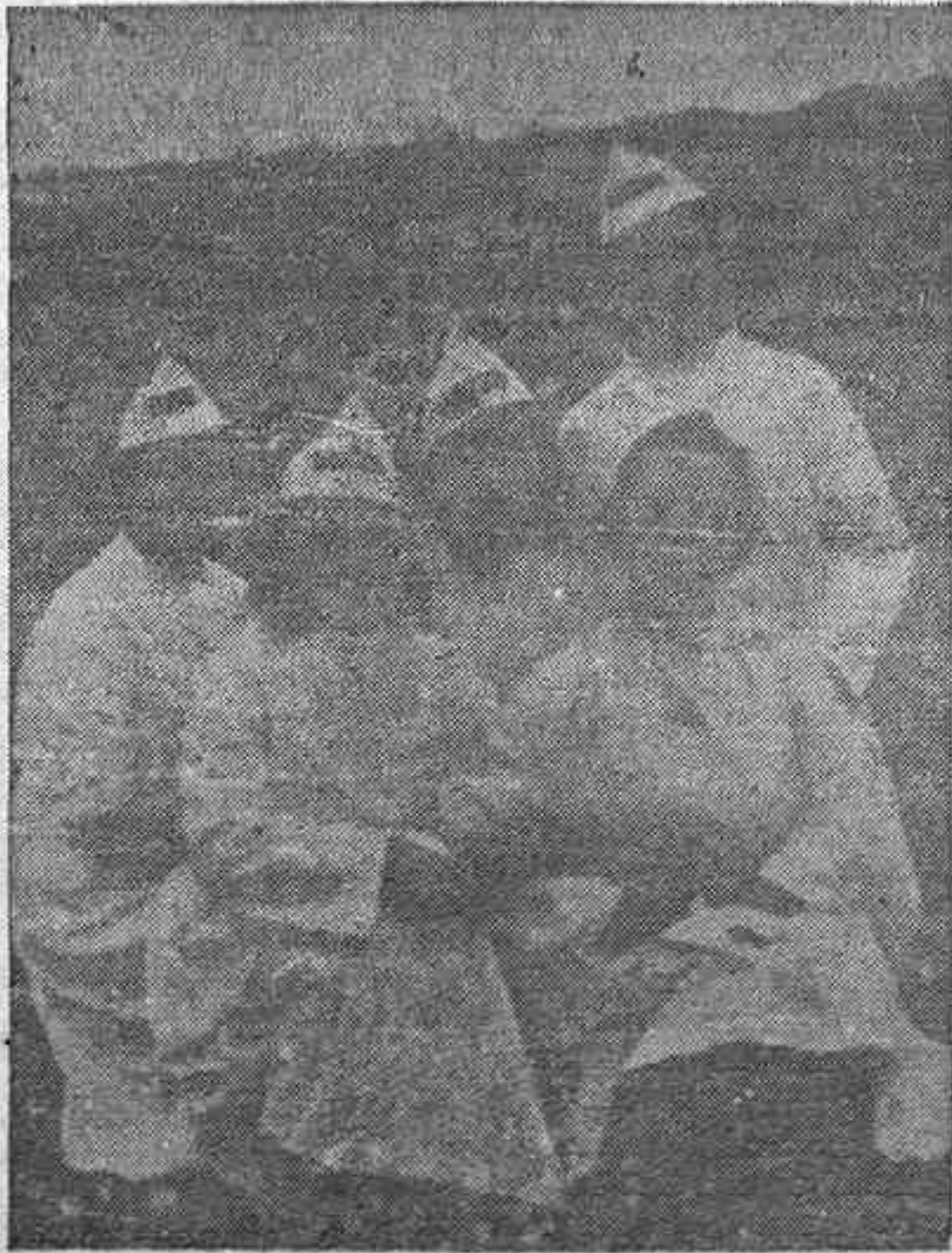
Grupo de compañeros del Batallón

Mañana se procederá a la firma del tratado comercial franco-checoeslovaco, representando a Che-