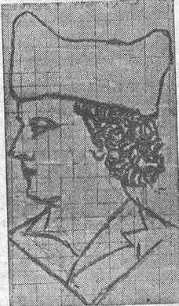
La burgalesa ex fascista

Seguimos al "Tuerto". Presumimos que nos reserva alguna sorpresa. Estamos en la