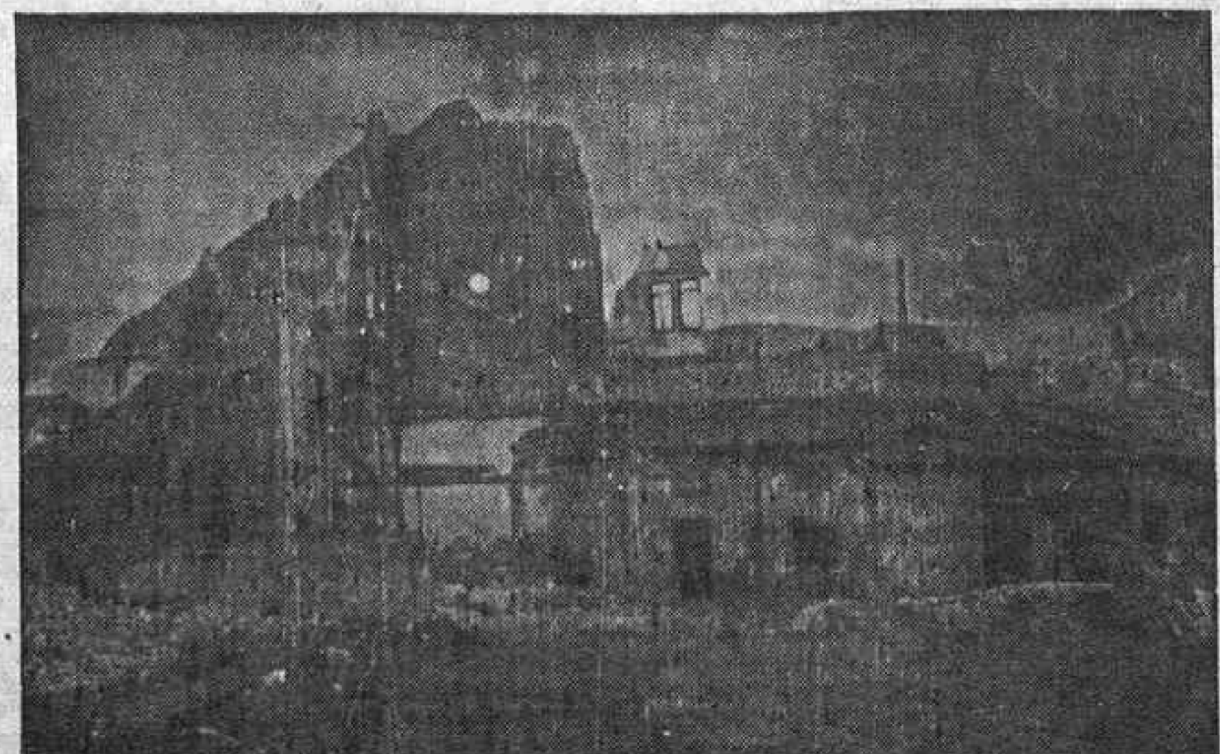
Ruinas del barrio de San Lázaro

sumaban agua y las nuevas posiciones eran preciso acondicionarlas, fortificarlas y disponerlas para evitar sorpresas. Esta fué la principal misión de nuestros milicianos durante la mañana: descansar un poco y trabajar en las fortificaciones. Pero llegó la tarde y ya andaban nerviosos y anhelando ser protagonistas de nuevas batallas.