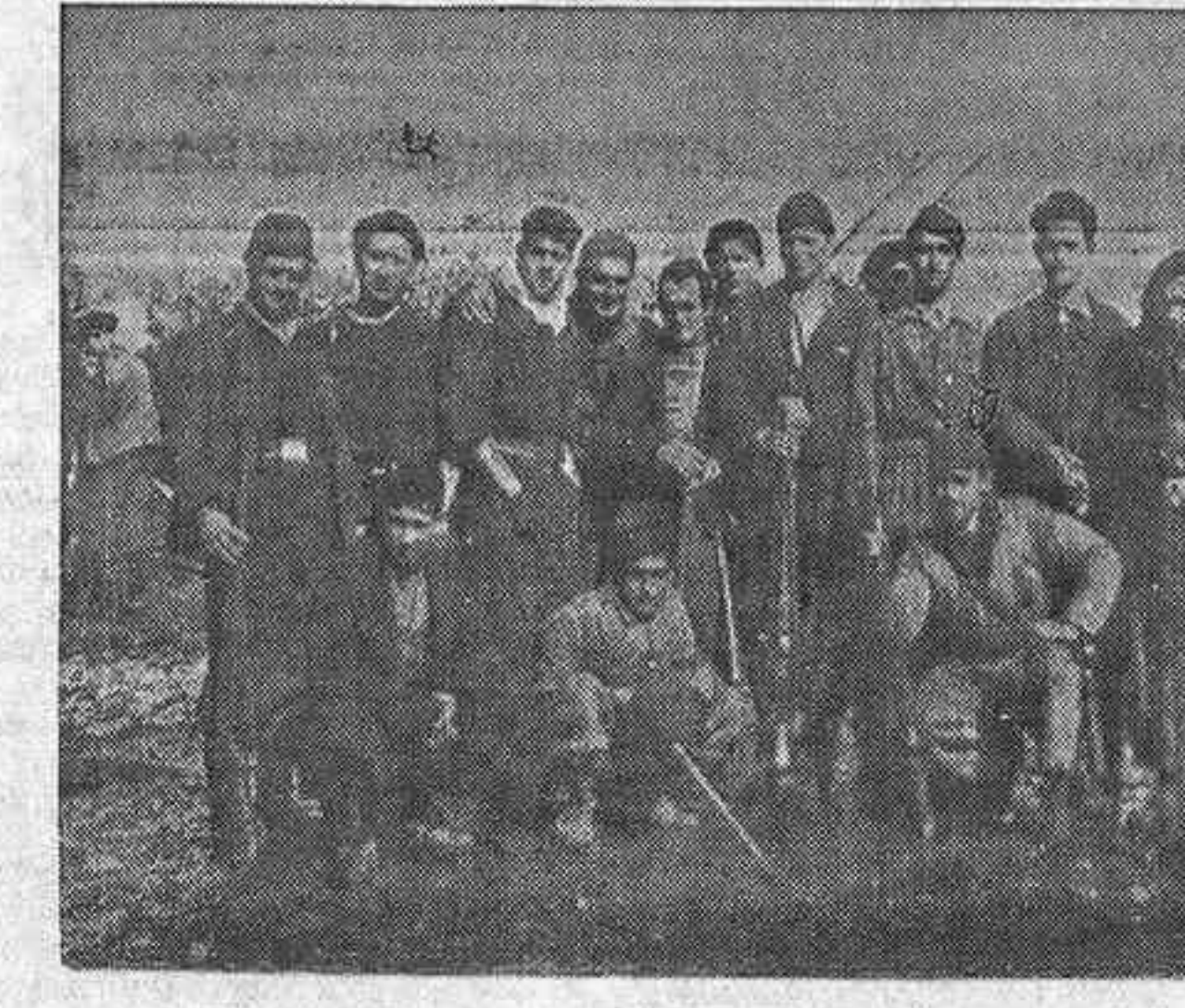
Grupo del Batallón Isaac Puente

Estamos más desahogados Volviose por la noche a combatir y también con el fruto deseado. Y actualmente nos encontramos más desahogados, porque existen allí unas trincheras naturales magníficas, formadas por las cercas de algunas edificaciones, desde las que se bate también mejor a Santo Domingo. Cuando por la tarde se inició el cañoneo de la Puerta Nueva Alta (calles de Concepción y Arzobispo Guisasaola) se hizo lo propio por la de Santo Domingo Cañonesas. Bombardearon y morteros. Dibujaban las explosiones los alrededores del convento. ¿Se iniciaba el ataque al mismo? Así lo hacía suponer esa actividad guerrera. Y estimamos que la noche es la más propicia para profundizar nuestras líneas por allí en busca de una nueva confluencia de fuerzas más adelante.