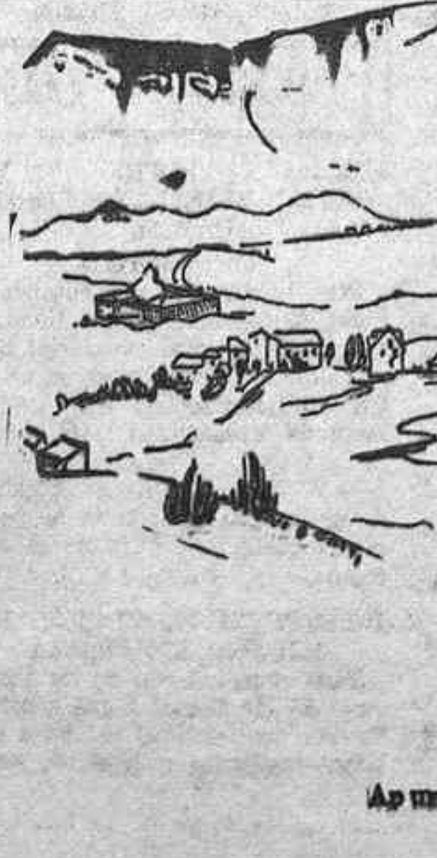
Apunte de la Cadellada y contorno (Por Mariano Moré)

Foguelo intenso Allá a la caída de la tarde, como estábamos acostumbrados a la calma, nos sorprende un foguelo intenso. Dura cerca de diez minutos e interviene principalmente las ametralladoras. A continuación oímos las explosiones de las bombas de mano y el estampido de los cañones de una batería nuestra. Seguidamente los rápidos tiros de los carros de Asalto. La parte de la calle de la Concepción y la del Arzobispo Guisasaola que dan envueltas por el humo de las explosiones. ¿No decían que el día de hoy iba a ser de calma? La realidad es muy otra. Desde un altoparlante dominamos perfectamente el lugar donde se opera. Con unos buenos prismáticos observamos