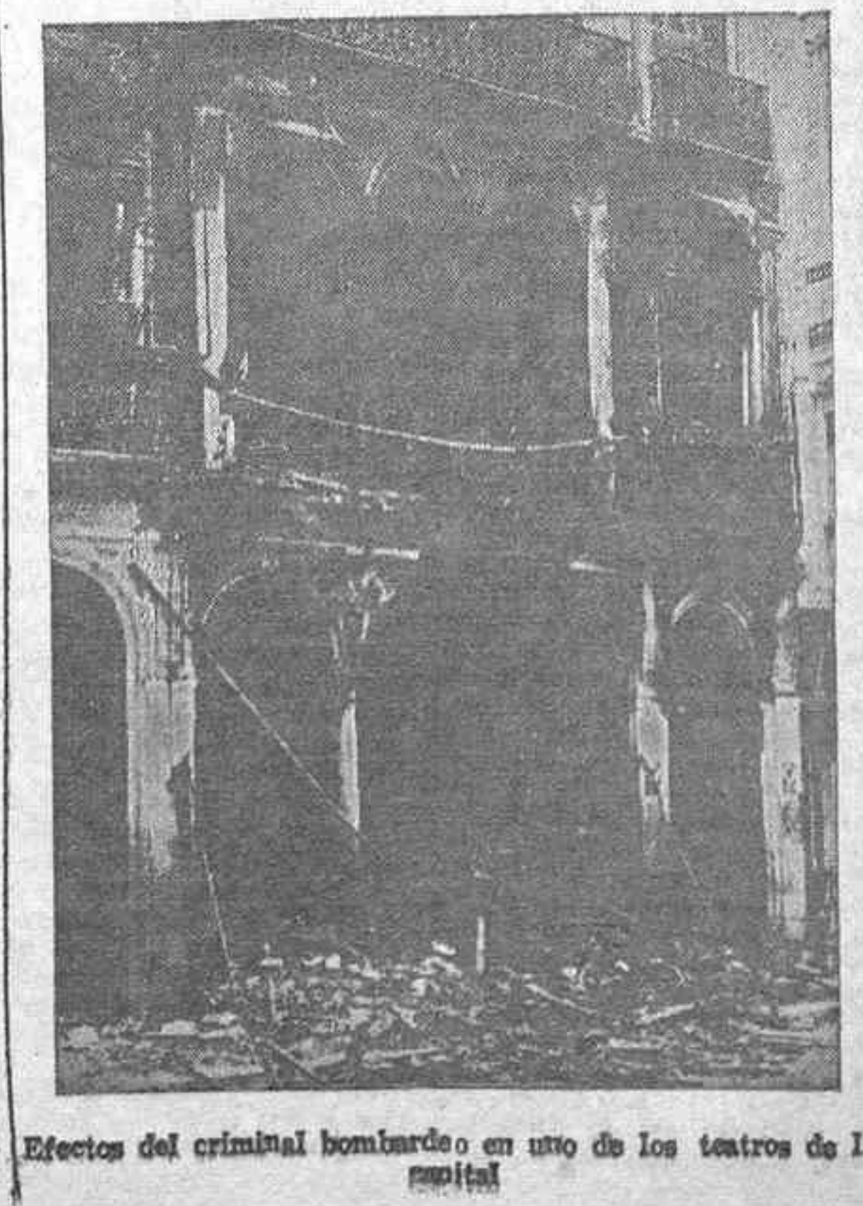
Efectos del criminal bombardeo en uno de los teatros de la capital