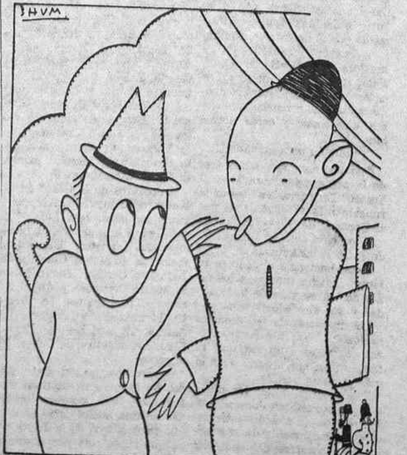
—No te apures; tenemos mucha tierra por delante. —¡Teníamos! ¡Cualquiera se la quita ahora a los campesinos!