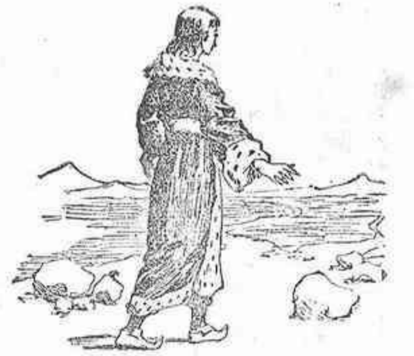
Por equipaje no llevó militares, arreos

El Benjamín se despidió de sus padres cuando regresaron molinos y tristes sus hermanos.