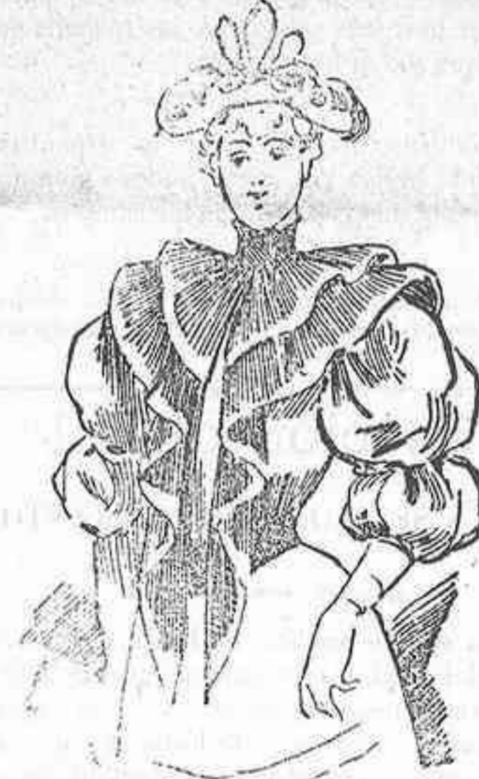
Vestido de paseo

Vestido de paseo.—Traje de recepción.—Vestido Ofelia.—Traje de visita.