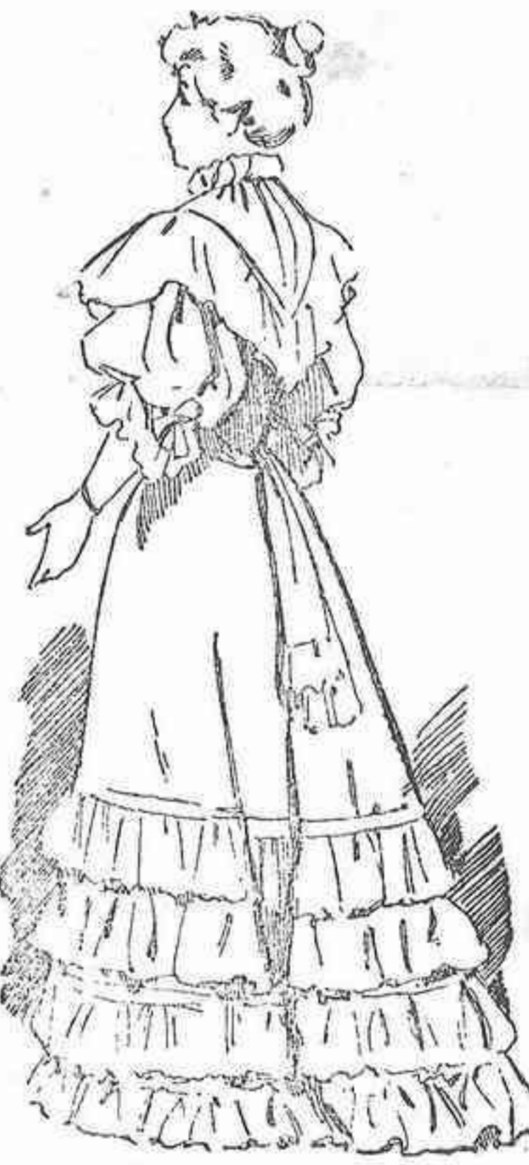
Traje de recepción

Las mangas son anchas y bullonadas en la parte superior y únense á otras estrechas y ajustadas de crespón ó granadina.