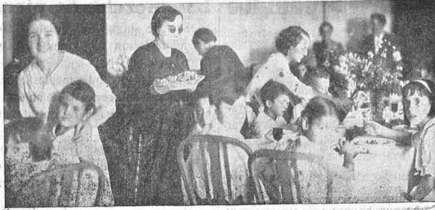
Banquete a los niños de los afiliados de Acción Popular

Ante la suspensión del mitin anunciado, en el que habían de hablar nuestros diputados, se organizó otro simpático acto