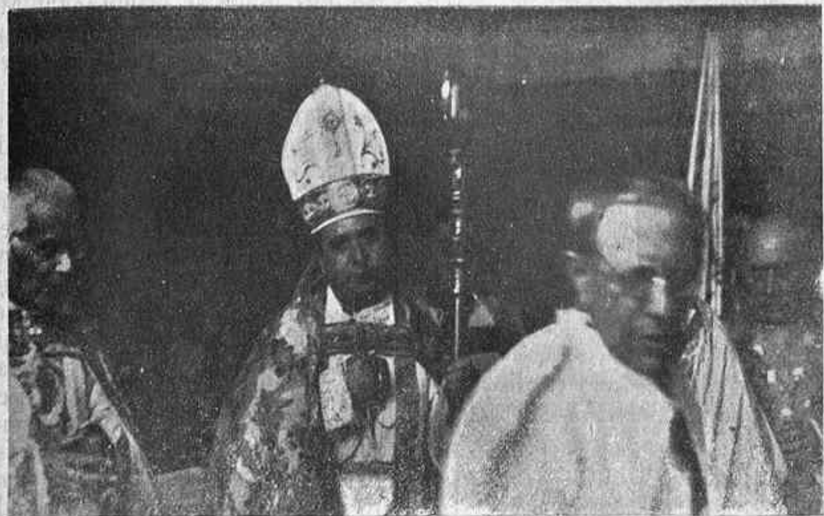
El señor Obispo haciendo su entrada en la parroquia de San Pedro, en Gijón

La entrada del Sr. Obispo en Gijón fué algo indescripible que superó cuantos cálculos se habían hecho