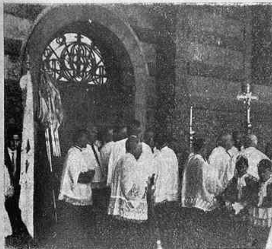
El clero de Gijón disponiéndose a recibir al señor Obispo

Pañería - Lanería - Sedería - Confecciones San Bernardo y Jovellanos Teléfono 13-19 GIJÓN