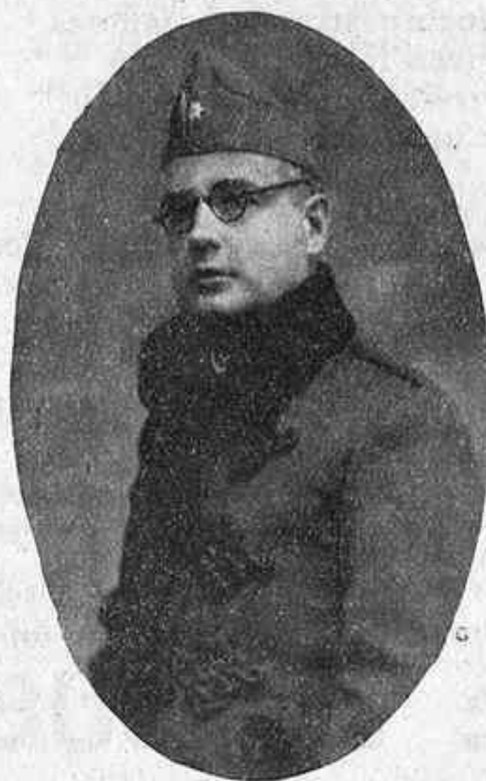
Un soldado de España

Para vencer y dominar las iras de la Revolución contaba España con esa gran reserva del patriotismo, con esa cantera de infatigables heroísmos, que es su Ejército.