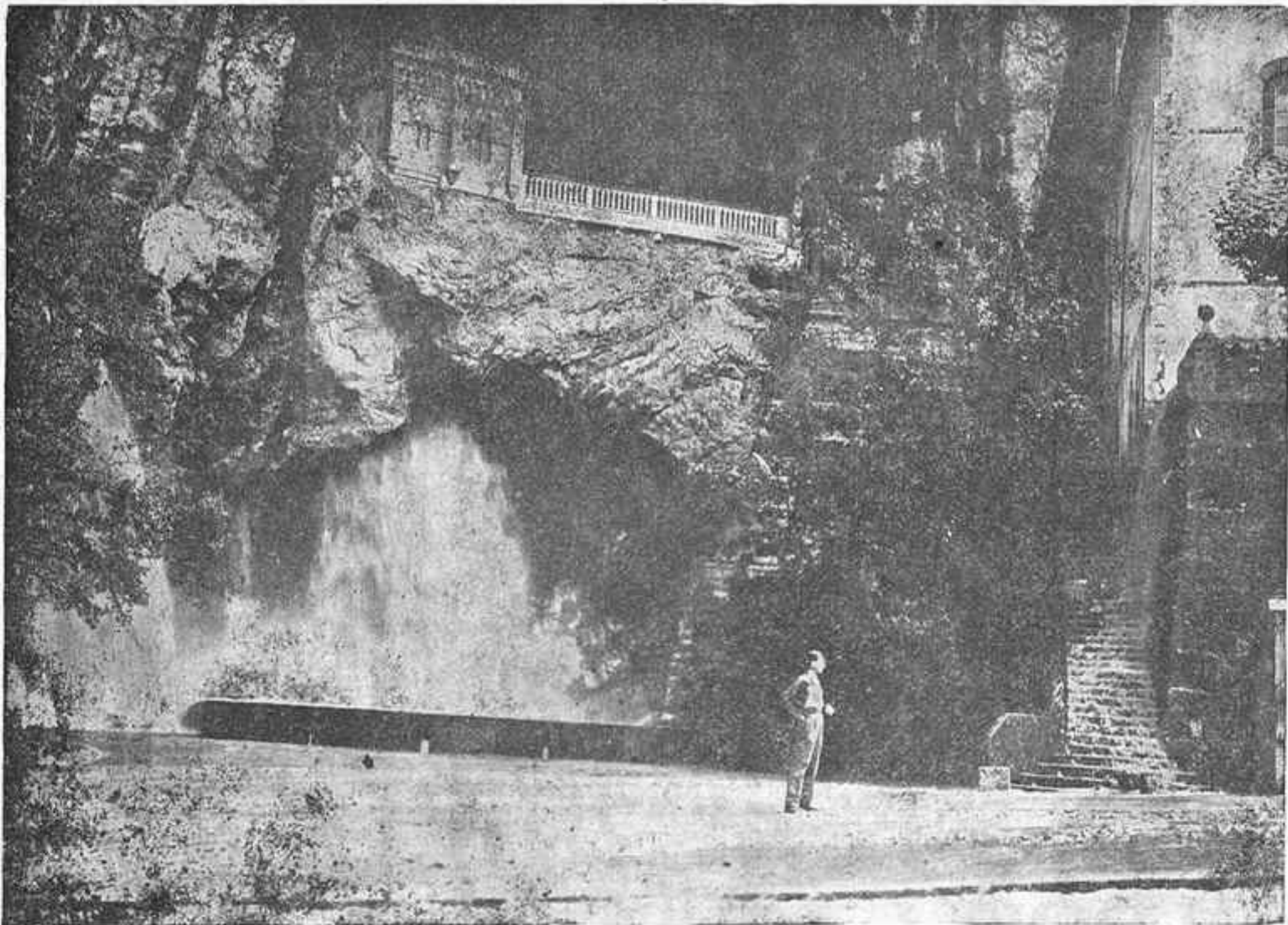
COVADONGA.—Plaza de la Virgen y cascadas.

La comparación entre tal acto y tales conductas con los actos y conductas que observan los elementos de izquierda, incita a pensar en que ya va siendo tiempo de que la inteligencia humana recobre su legítimo imperio sobre el hombre y que este use de ella para orientarse en la vida, dando de lado a los voceadores de doctrinas y procedimientos que ya deberían estar suficientemente desacreditados.