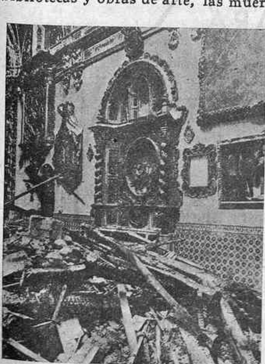
El templo de San José, de Madrid Por aquí pasó la barbarie del odio anticatólico

Diez, once y doce de mayo. Estas fechas deben ir constantemente unidas a los nombres de quienes consintieron los asaltos a iglesias y conventos, la quema y destrucción de bibliotecas y obras de arte, las muertes, horrores y profanaciones que se perpetraron en esos tres días de horror e ignominia.