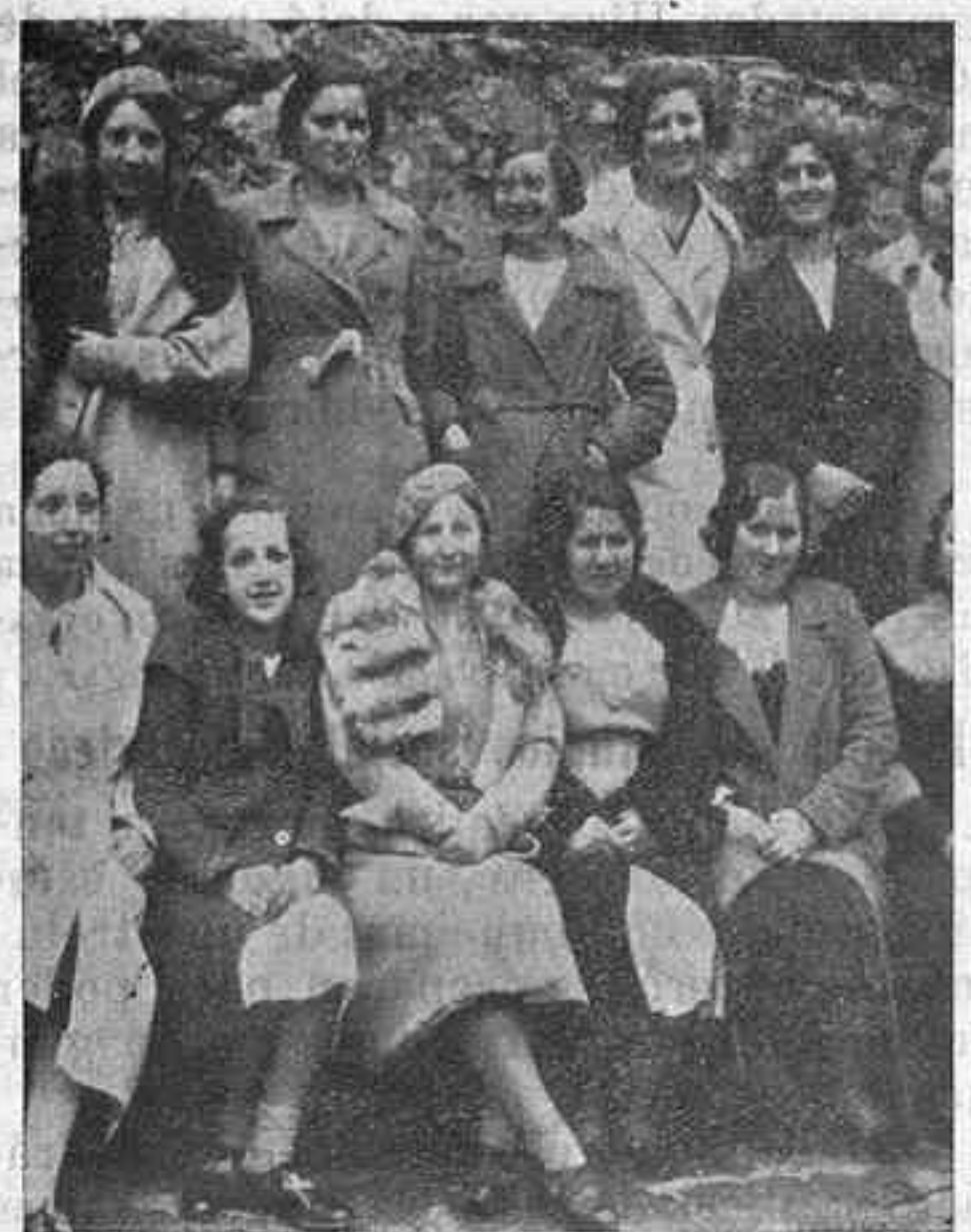
Profesoras y alumnas de la Escuela del Hogar, en su excursión a Covadonga.

porque presentan surtidos grandísimos y los precios están siempre al alcance de todas las fortunas.