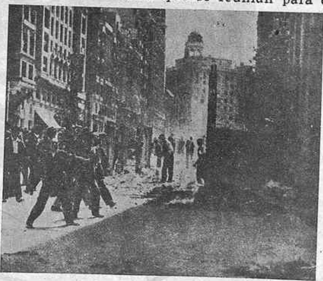
Otra escena de los incendios de Mayo Actitudes airadas de los cobardes asaltantes, que arrojan piedras sobre indefensos religiosos. Sangre en el suelo; brasas y fuego en todas partes

Allí está en la calle, engreído, alevoso traidor, bajo y rufianesco, el incendiario; y en las alturas, en el Ministerio de Gobernación, el coonestador, que a nuestros ojos, resulta aún, si cabe, más odioso y despreciable que el ejecutor de los mandatos de la masonería.