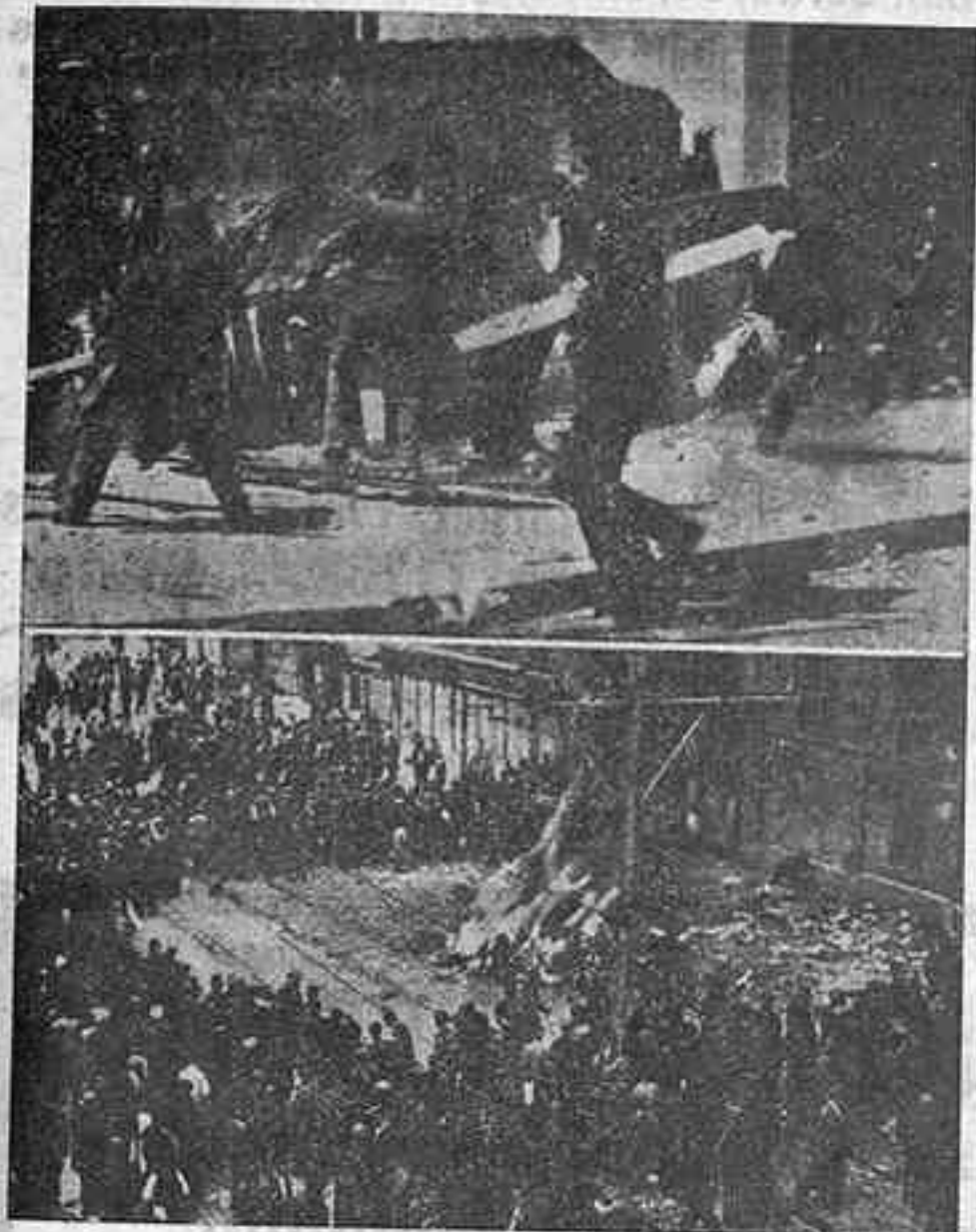
Los incendios y asaltos sacrilegos de Mayo del 31 en Madrid He aquí dos documentos de irrefutable fuerza que prueban la pasividad de las autoridades

Once de Mayo de mil novecientos treinta y uno. Esta es la fecha infausta que todos los católicos debemos tener siempre presente. En nuestra Historia debe quedar grabada, como un estigma, con caracteres indelebles de sangre y fuego.