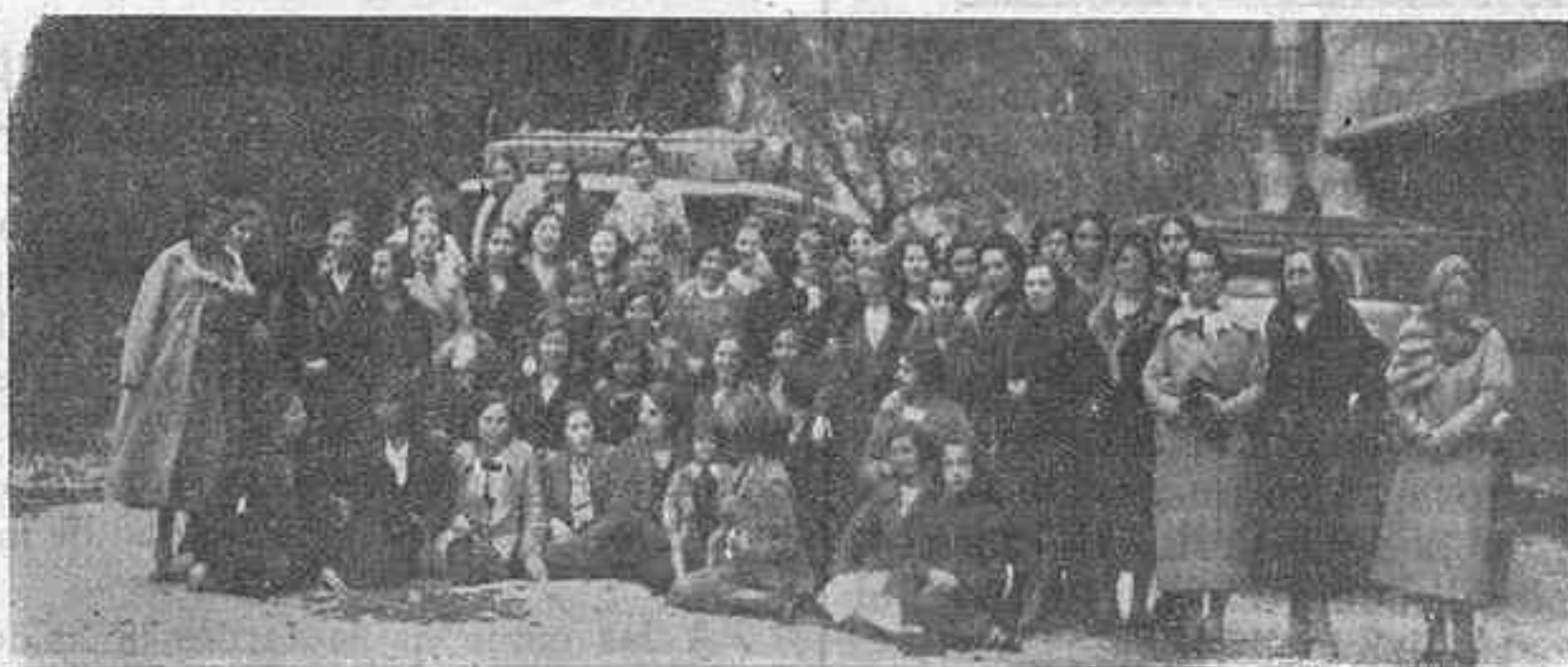
En el Santuario de Covadonga.—He aquí el grupo de los excursionistas de la Escuela del Hogar, que funciona bajo la dirección de las señoritas de la Juventud Católica Femenina, y de cuyo viaje dábamos cuenta en nuestro número anterior.

Después de la ceremonia religiosa, fueron obsequiados los niños y sus familiares con un espléndido desayuno, que fué servido por las señoritas catequistas.