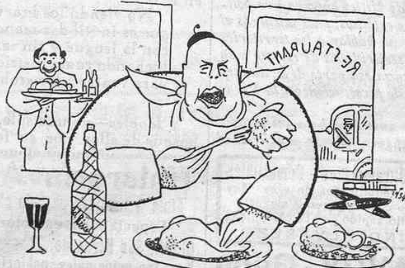
—¡Reajol ¡Y que diga Gil Robles que yo no tengo contextura de revolucionario!..