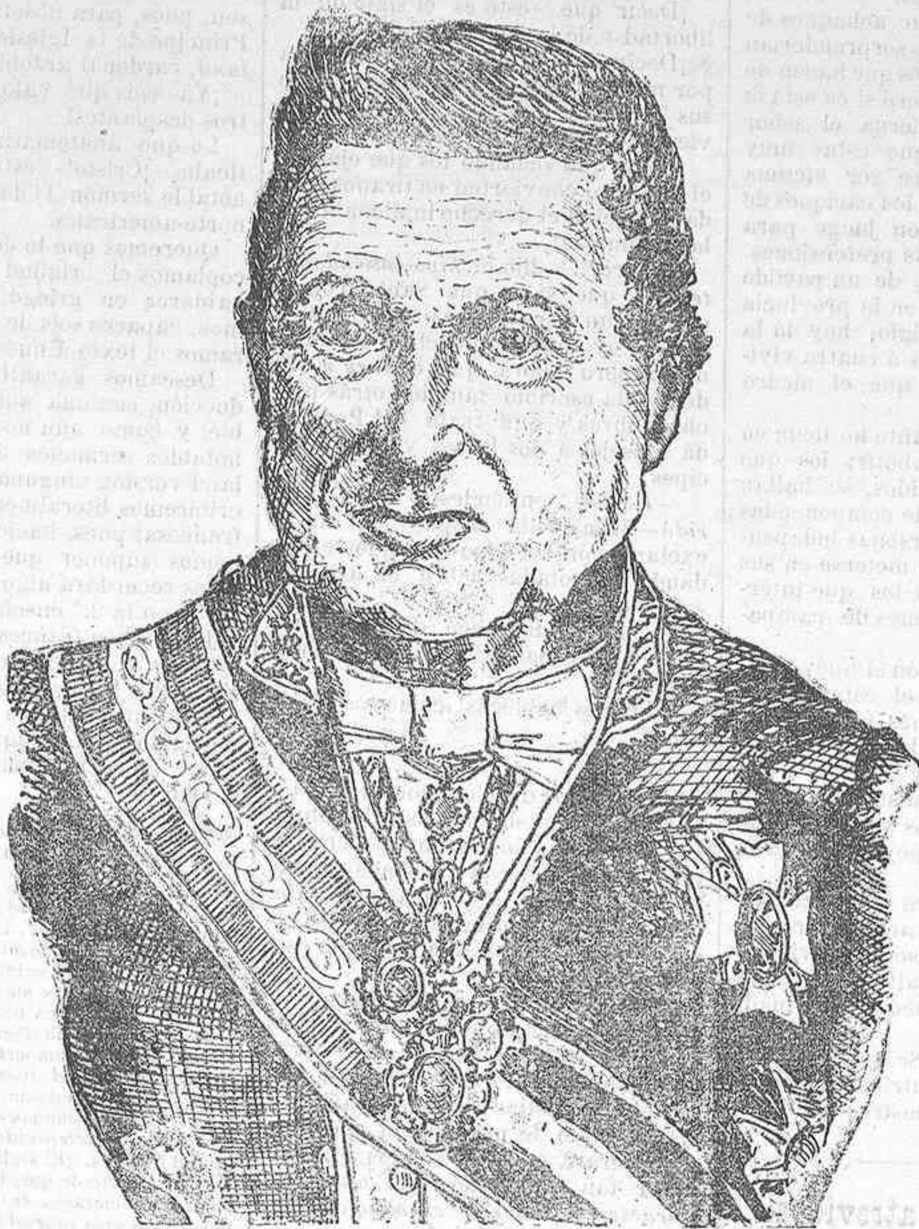
EXCMO. SR. D. JOSÉ CAVEDA

No fué Ministro, aunque tuvo el gusto de renunciar una cartera, que debe ser uno de los menos comunes. En el tiempo en que más figuró Caveda y en que se renovaban los estudios, comenzando, por decirlo así, los administrativos, los literatos y políticos se envidiaban menos y se emulaban más que ahora y era frecuente verlos reunidos en las redacciones de los periódicos, en las Cortes y en las Academias. El Conde de San Luis se