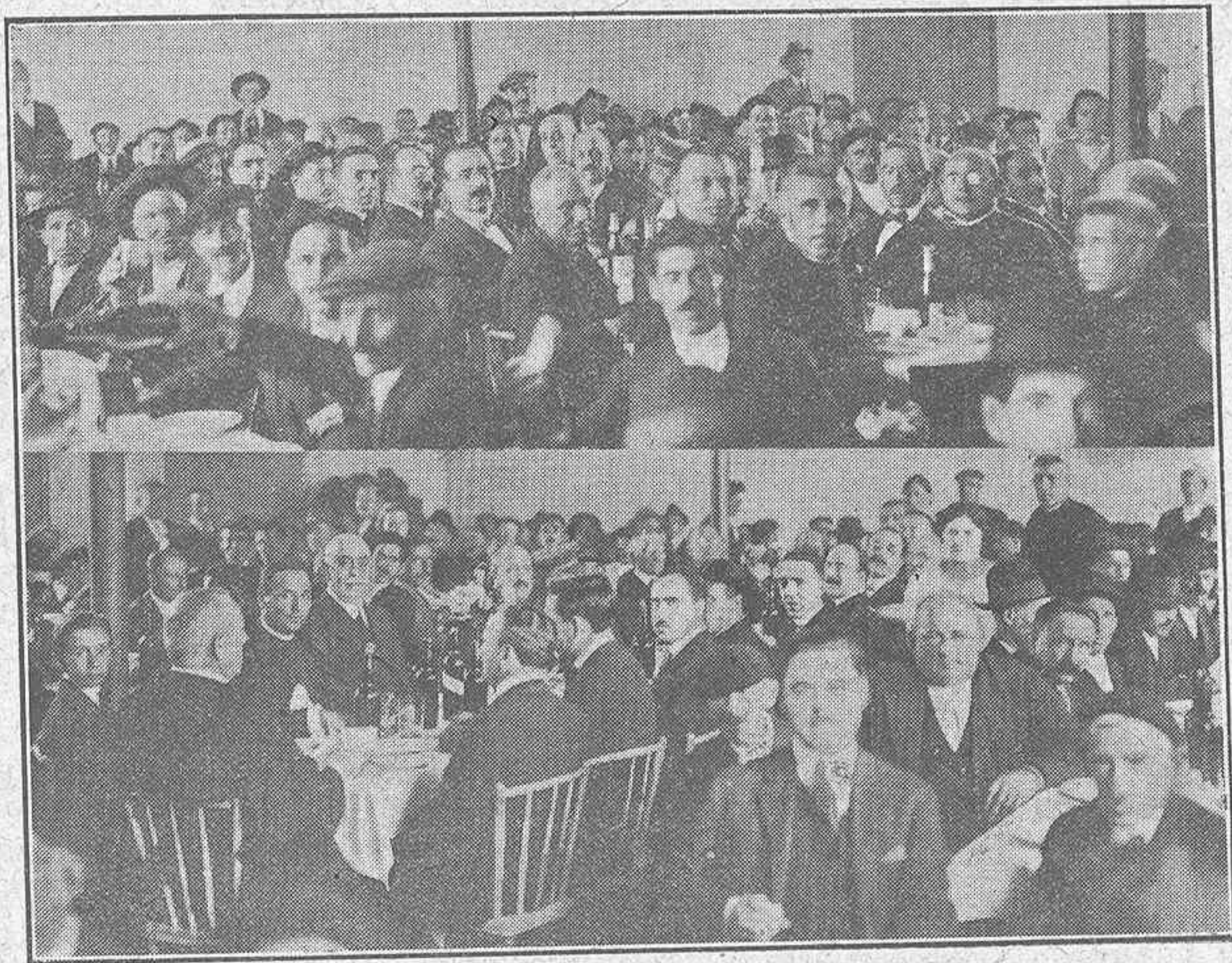
NUESTRA "FABADA".—Dos aspectos del Banquete popular

entabló un amplio cambio de impresiones en que intervinieron varios representantes de Sindicatos y miembros del Consejo. Unánimemente se aprueba que se siga estudiando la cuestión del reaseguro para lo cual se considera indispensable que todos los Sindicatos establezcan el seguro del ganado con