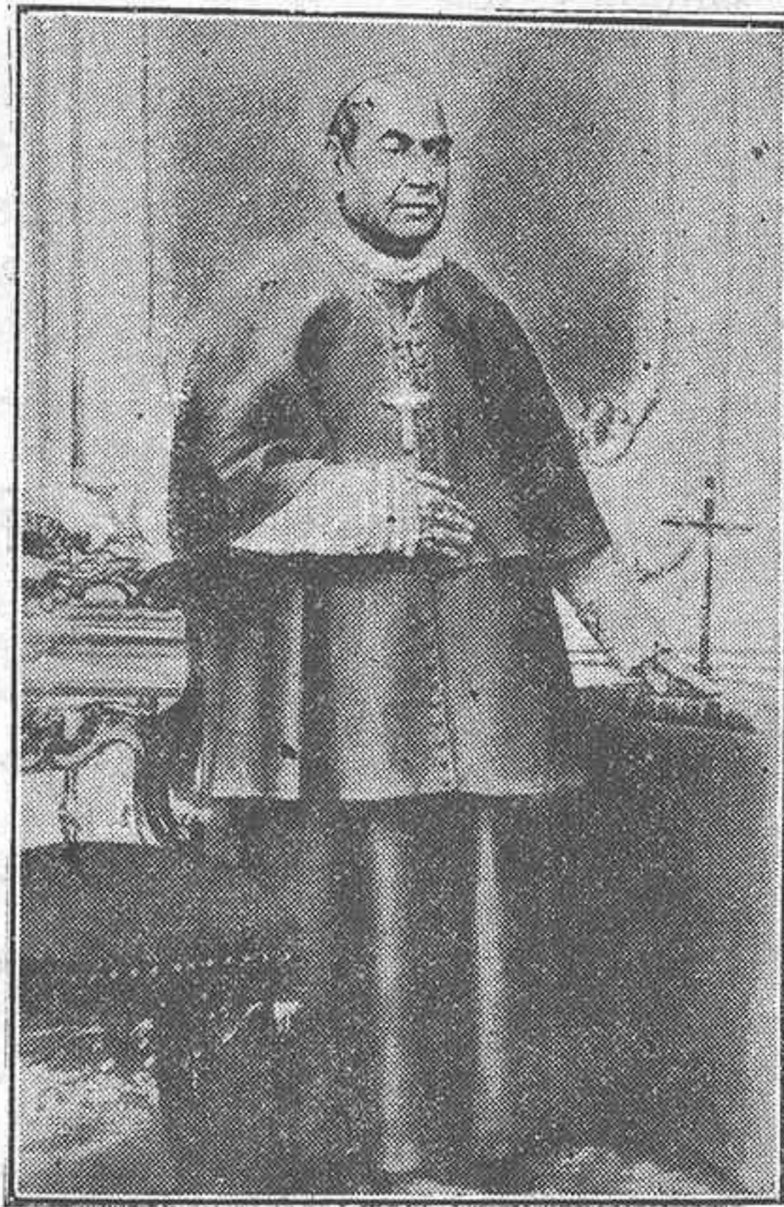
El Beato P. Claret