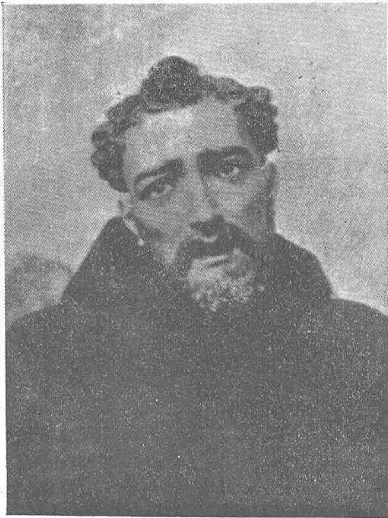
«San Francisco de Asís»

Cuenta San Buenaventura cómo el Santo de Asís, para encender la devoción del pueblo, dispuso en la iglesia «un establo, que llenó de heno e hizo traer a una mula y a un buey: fueron llamados los frailes... la muchedumbre llenó el bosque, que resonaba con el eco de sus voces... Desbordante de piedad, el hombre de Dios permanecía en lágrimas ante el pesebre; cantó el evangelio; después predicó el nacimiento del «bebé de Belén», que así le llamaba en la extrema ternura de