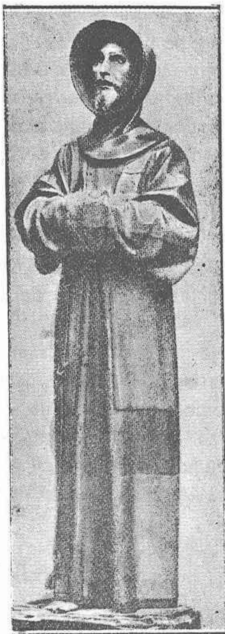
Escultura del Tesoro de la Catedral de Toledo. Pedro de Mena.

parte, con el color blanco y colorado, como si estuviera vivo. Tenía las manos cubiertas con las mangas del hábito delante de los pechos, como las acostumbran a traer los frailes menores; y viéndole así el Papa... alzó el hábito de encima del un pie, e vió él y los que allí estábamos que en aquel sancto pie estaba la llaga con la sangre tan fresca y reciente, como si en aquella hora se hiciera.»