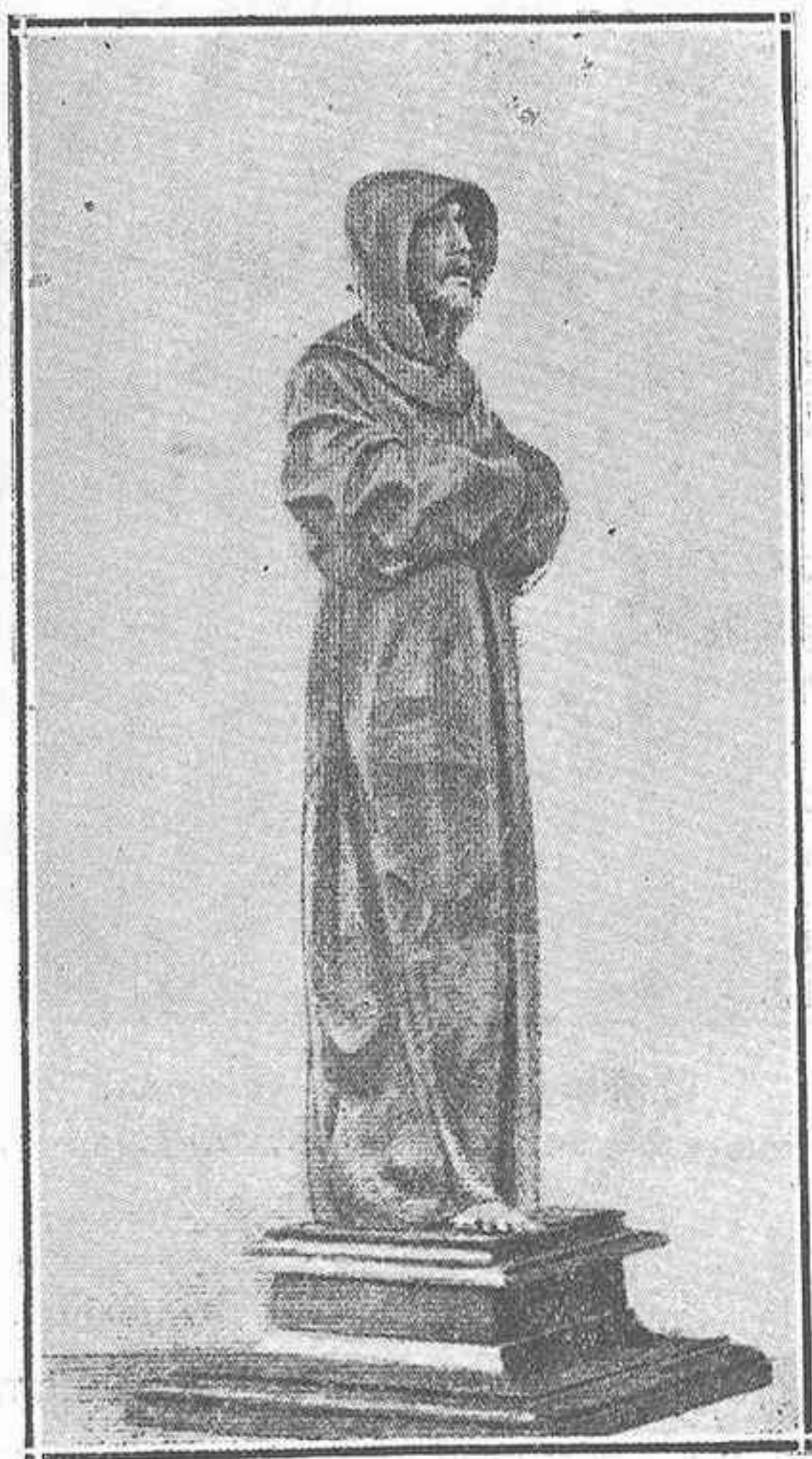
Aguafuerte de Gaujean de una escultura de Alonso Cano, hoy en paradero desconocido.

No ha de sorprendernos éxito tan grande 85 . Es el San Francisco de Mena uno de los mayores aciertos del arte español: sin detalles anecdóticos, sin recursos que hablen a la fantasía, conmueve