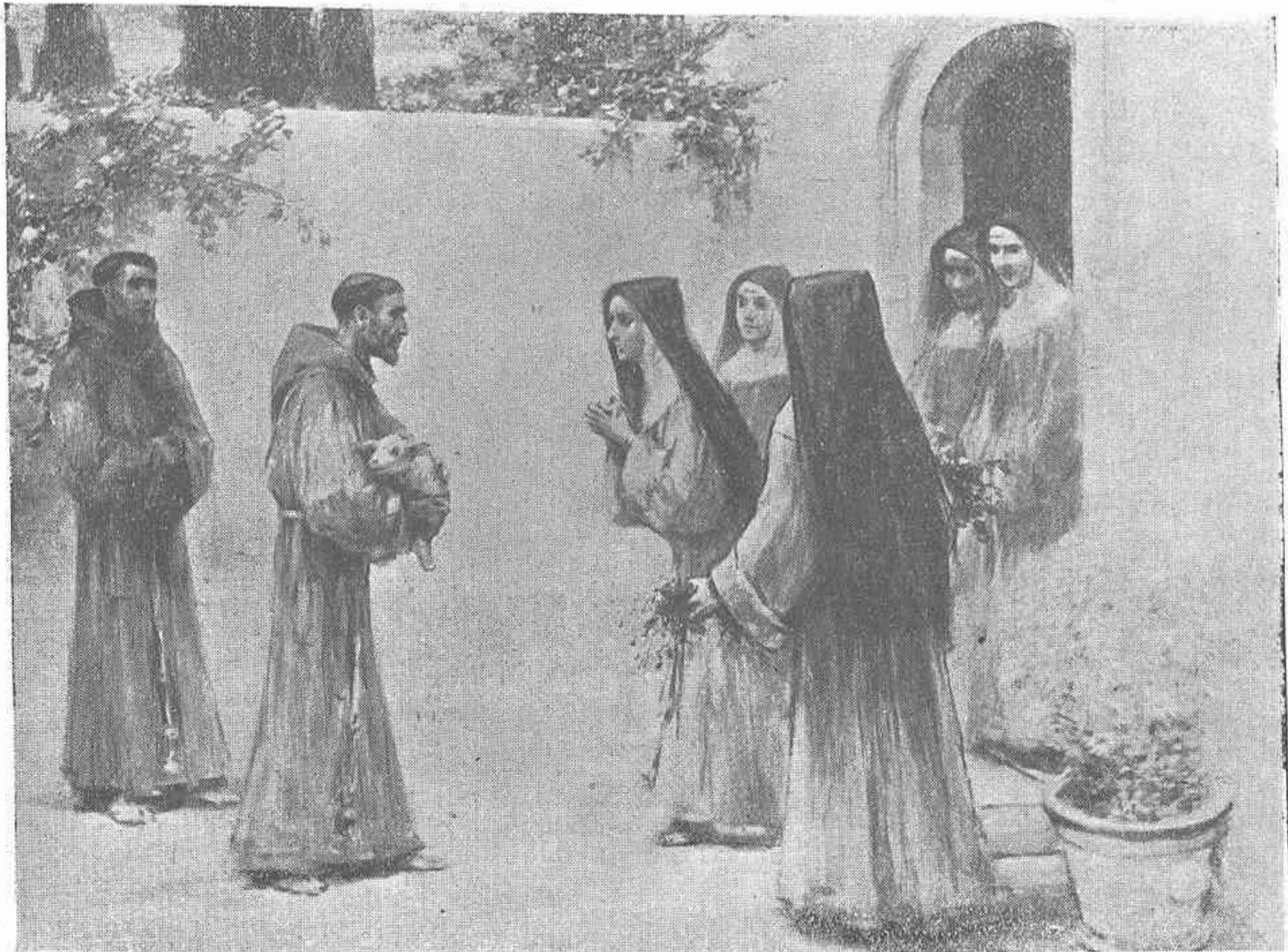
SAN FRANCISCO OFRECE UN TIERNO CORDERILLO A LAS MONJAS DE SAN SEVERINO

do perder el momento contemplado; así su obra es más somera que profunda; es el artista que todo lo lleva en la retina. Benlliure a su vez es el pintor contemplativo que se extasía ante un motivo y lo estudia y analiza a fin de darle forma y que cuando este motivo ha llegado a tomar ya consistencia se ve en él, el depurado estudio y la meditación que le precedió.