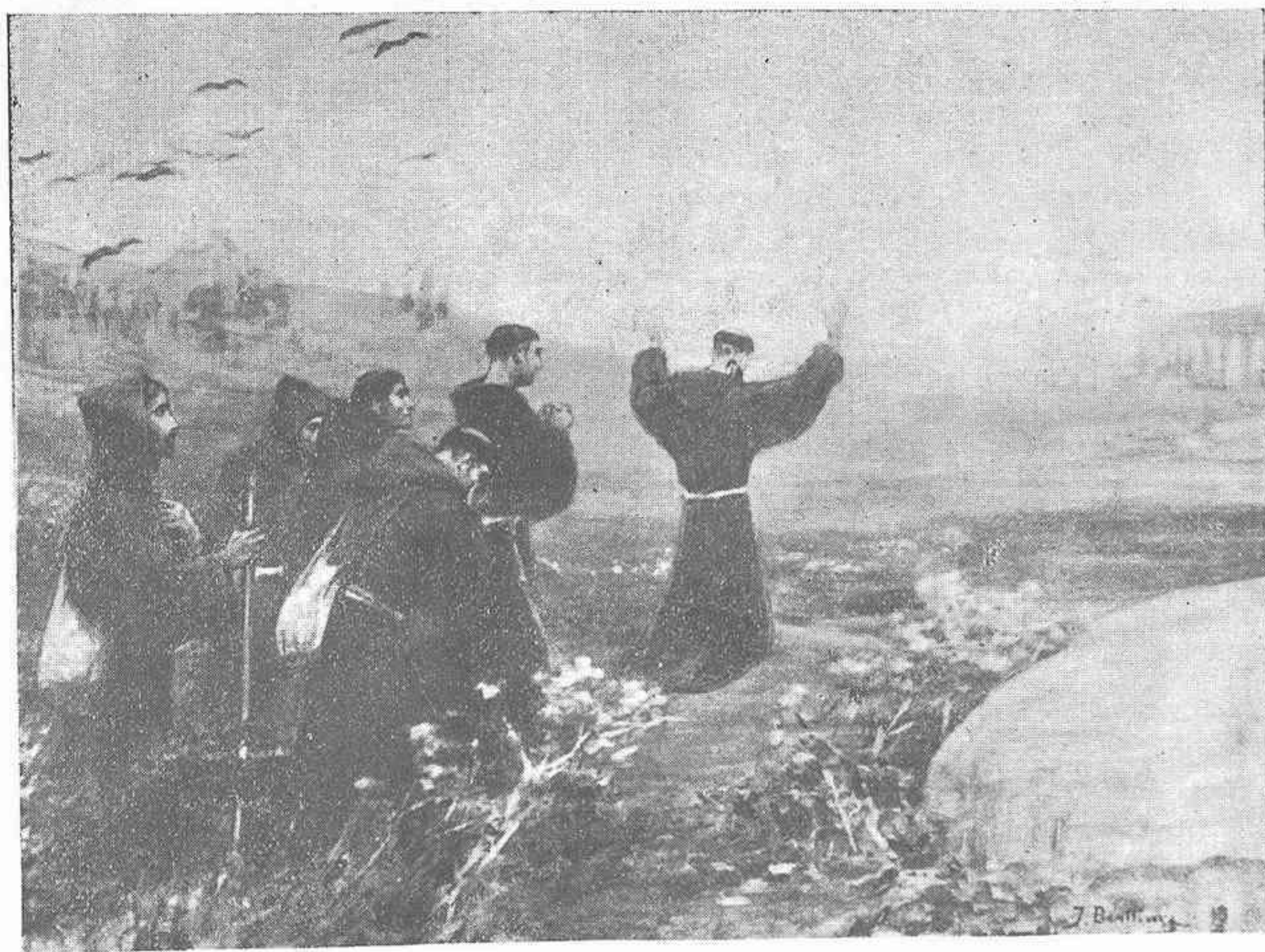
SAN FRANCISCO Y SUS DISCÍPULOS SE POSTRAN REVERENTEMENTE A LA VISTA DE ROMA

He aquí todo lo más someramente posible trazada la impresión sobre la obra francis-