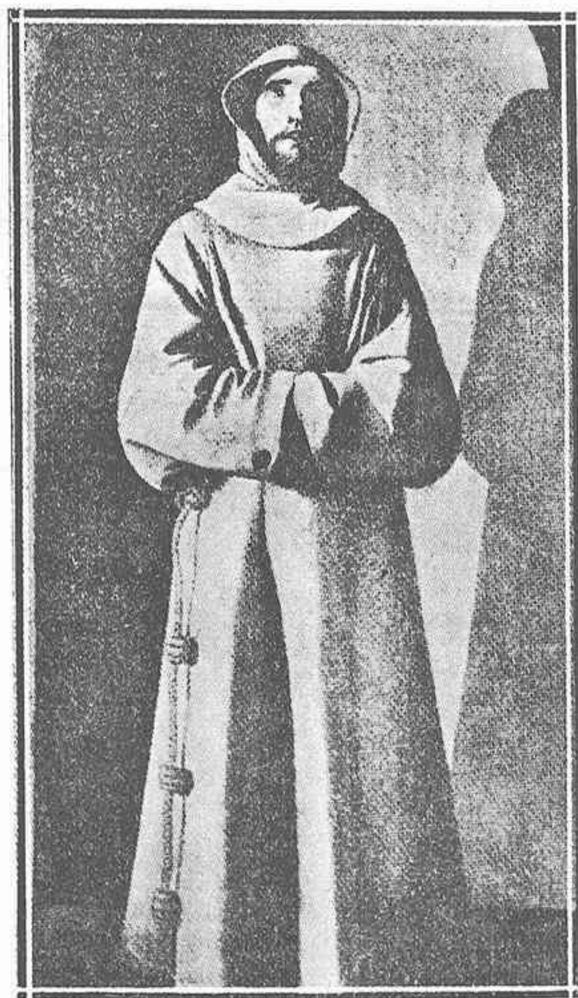
Pintura de Francisco Zurbarán. Colección del Dr. Carvallo (Château de Villandry, Turena).

Sin duda, el que siempre hay que aducir cuando se trata de Mena: Alonso Cano. En efecto, el Barón Ch. Daviller dió a conocer en 1879 un San Francisco, que estaba entonces en la colección Odier, que el Sr. Gómez Moreno cree de Cano, y en relación directa e inmediata con el de Toledo 83 . La fecha del San Francisco del coro de Málaga prueba, en mi opinión, que el de Cano será obra de sus últimos tiempos madrileños: se ignora su actual paradero. La mayor diferencia estriba en que la capucha no consiente que se vea el cuello en la imagen del Tesoro, y que su contorno dibuja un óvalo perfecto, mientras que en la escultura conocida por el grabado al descubrirse el cuello y al ondularse con blandura la capucha gana en