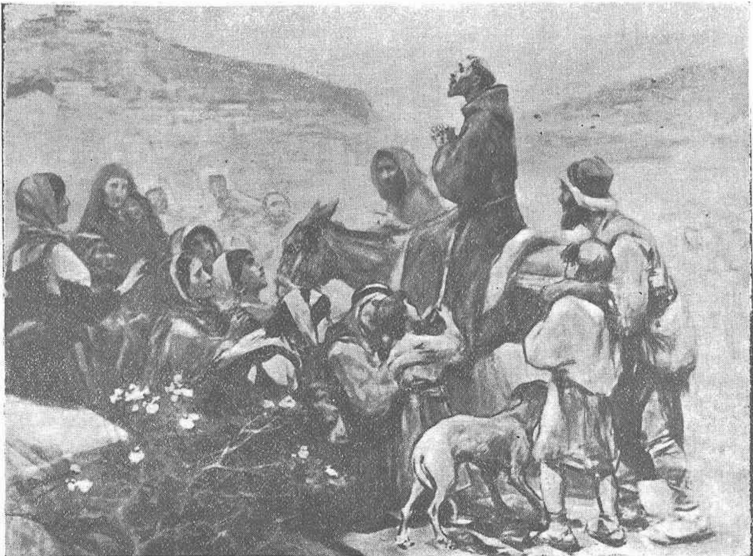
¡ECCO IL SANTO!

línea, de fondo, de alma y no de colorines, encontramos en ella al creador. En estos tiempos, en los que el amaneramiento y la ruta común marcan camino a los artistas valencianos, en su mayoría más que artistas discípulos, Benlliure es un creador; un creador experto, lleno de vida, de fibra, de juventud; un creador que tiene el alma renacentista llena de fe, que vive y alienta tan solo para su arte sin desmayar ni una sola hora.