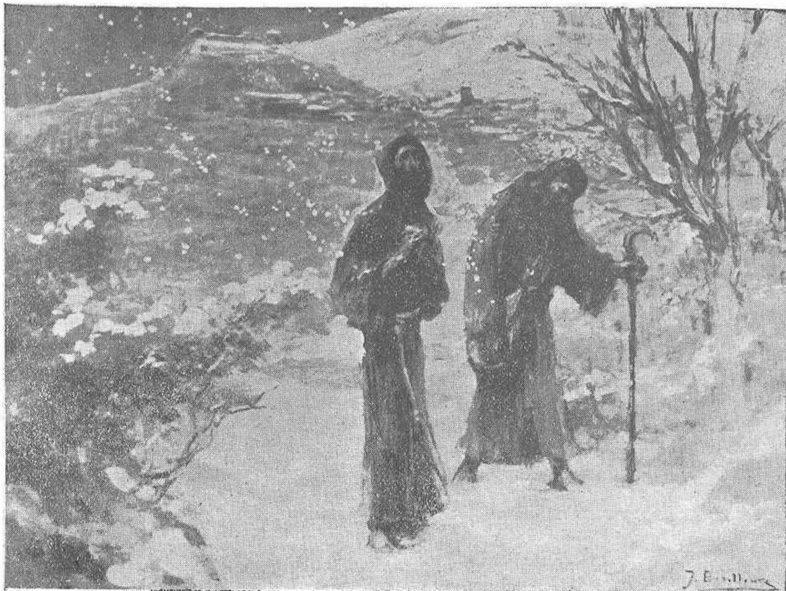
SAN FRANCISCO Y FRAY LEÓN CONTINUÁN SU VIAJE A PESAR DEL FRÍO Y DE LA NIEVE