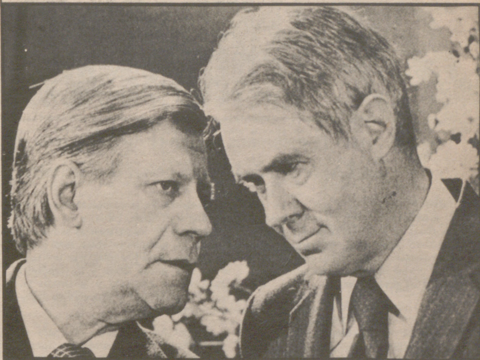
BONN.— El canciller alemán Helmut Schmidt conversa con el secretario de Estado norteamericano, Cyrus Vance, durante la rueda de prensa que ofrecieron después de las conversaciones mantenidas en la cancillería, al regreso de Vance de Moscú.