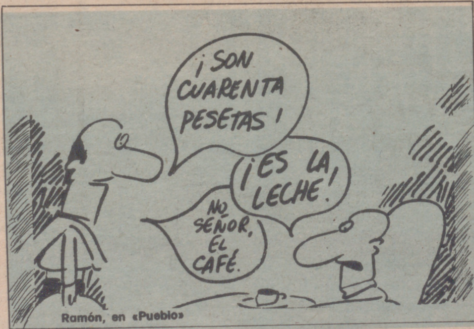
Ramón, en «Pueblo»