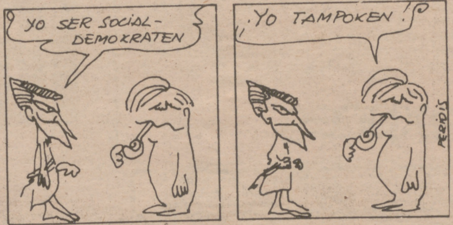
Peridis, en «El País».