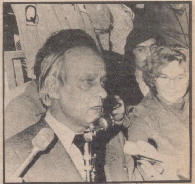
MONTREAL.— El dirigente del partido separatista de Quebec, René Lévesque, dirige la palabra a sus seguidores en el Colegio Gerard Filion, en Longueuil, tras las predicciones de la CBC (Canadian Broadcasting Corporation) emisora canadiense, en el sentido de que su partido había ganado las elecciones provinciales con un gobierno mayoritario. Uno de los seguidores hace ondear la bandera de Quebec.

● DIFICULTADES PARA LA INDEPENDENCIA DE QUEBEC