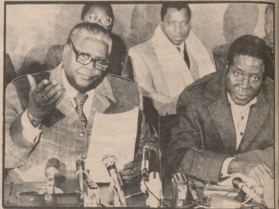
GINEBRA.— Joshua Nkomo, a la izquierda y Robert Mugabe, líderes del Frente Patriótico de Rhodesia en una conferencia de prensa en la que acusaron a Inglaterra de vaguedades en la fijación de una fecha específica para la independencia de Rhodesia.

Los labriegos fueron asesinados a tiros, tras ser condenados a muerte por suministrar informes a las autoridades que persiguen a los grupos de alzados en armas en esa zona.