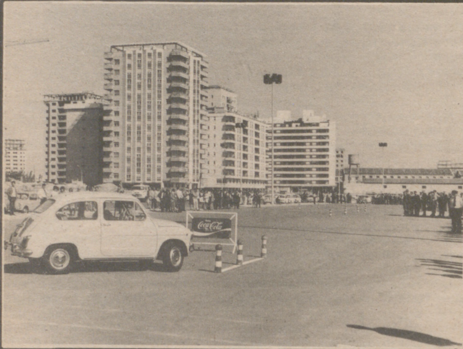
Aprobar el examen de conducir, no basta

■ La OCDE propone un nuevo sistema educativo