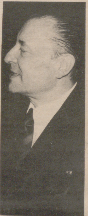
que la ley de principios "posee su propia singularidad" y con ella "un valor relevante".

Por eso, Franco, previendo la argumentación de la ponencia, de que desde el punto de vista legal las Leyes Fundamentales tienen el mismo rango jurídico, aseguraba