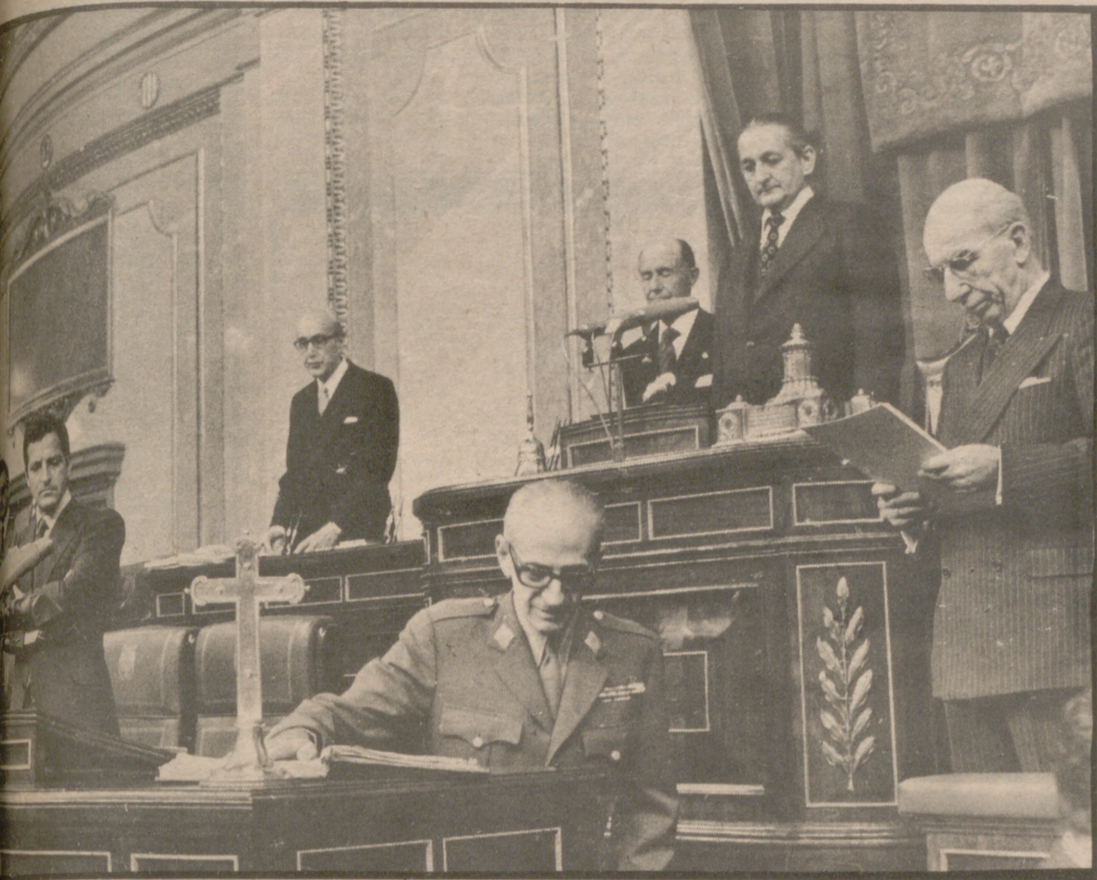
En la foto, el teniente general D. Manuel Gutiérrez Mellado, vicepresidente del Gobierno para asuntos de la Defensa, presta juramento como procurador en Cortes, en el Pleno de ayer.