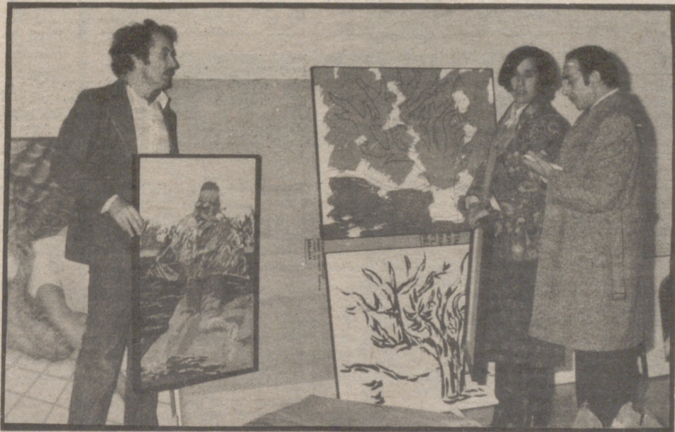
Los encargados de los diversos stands se afanan en colocar los cuadros.

—¿Podría usted aventurar el valor de los cuadros de esta feria? —Eso es difícilísimo. Hay algunos cuyo precio supera el millón de pesetas. Poniendo una media de doscientas mil pesetas serán sesenta millones. Pero ya le digo: es difícil calcular.