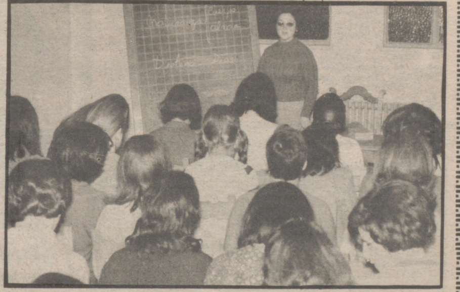
Con un poco de tiempo dedicado de vez en cuando al cabello de los niños se pueden evitar desagradables sorpresas. Los parásitos se mueven a sus anchas en los colegios

Robar momentos al programa preferido de la televisión el fin de semana agobian te, al