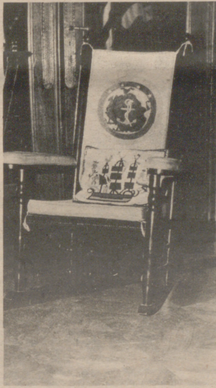
Es costumbre que el Presidente y los ministros norteamericanos, al cesar, se lleven a su casa el sillón de trabajo que utilizaron durante el desempeño de su cargo, previo pago de un precio simbólico. Esta es una de las mecedoras de la Casa Blanca que se llevó la familia Kennedy, después del asesinato en Dallas.

Pero no se entrega tal mueble gratuitamente al presidente saliente, puesto que él no lo llevó a la Casa Blanca, sino mediante pago de un precio que, por su pequeño importe, es más bien simbólico. Ese sillón pertenecía al patrimonio público, había sido costado con cargo al presupuesto nacional federal, por lo que no puede convertirse en bien privado, a título de obsequio