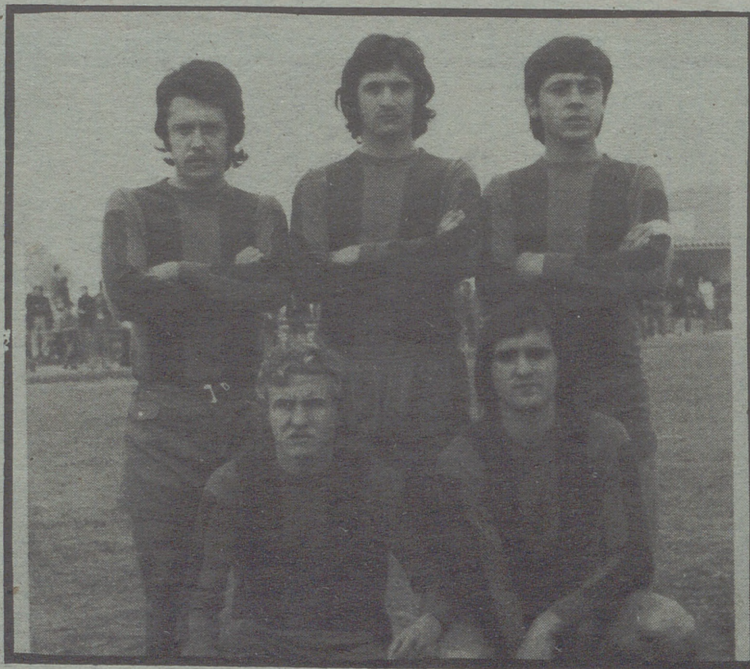
LOS CEDIDOS DEL ARAGON AL OLIVER

COMO todos lo conocen, y más aún su corto y brillante historial, sólo presentamos aquí sus credenciales, en la actual temporada, escritas domingo a domingo, con firme trazo, en los terrenos de juego: valiente, veloz, con fuerte tiro desde fuera del área, y con perfecta colocación para ser oportuna, en el área del "hule".