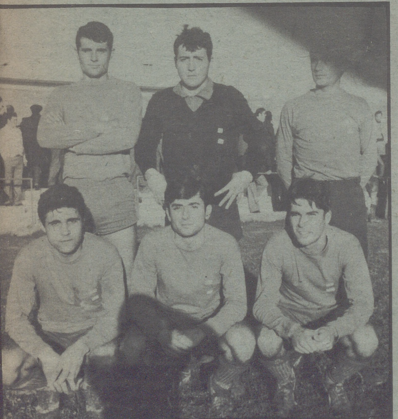
Aquí, seis de los catalanes que juegan en el Gallur

Pero cuando, van dirigidas a nosotros y de algo se nos acusa ya sea verdad o un simple rumor, ponemos el grito en el cielo y hablamos amenazando, como si eso diera más fuerza, a algo que se intenta justificar y que no se puede.