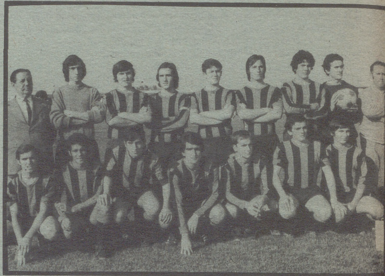
S. D. ARENAS

JUV. DE BARBASTRO — ARENAS S. D.— Mala papeleta se le presenta al entusiasta equipo del Juv. de Barbastro, pues con cuatro negativos recibe a un Arenas en gran forma y además hambriento de positivos, ya que para poder optar a uno de los puestos de ascenso tendrá que sumar alguno más a los que posee, por tanto en este partido tratarán sus jugadores con el mayor entusiasmo traerse los dos puntos, objetivo que nosotros creemos logrará aunque como es lógico con todo tipo de dificultades. Por tanto victoria corta del Arenas.