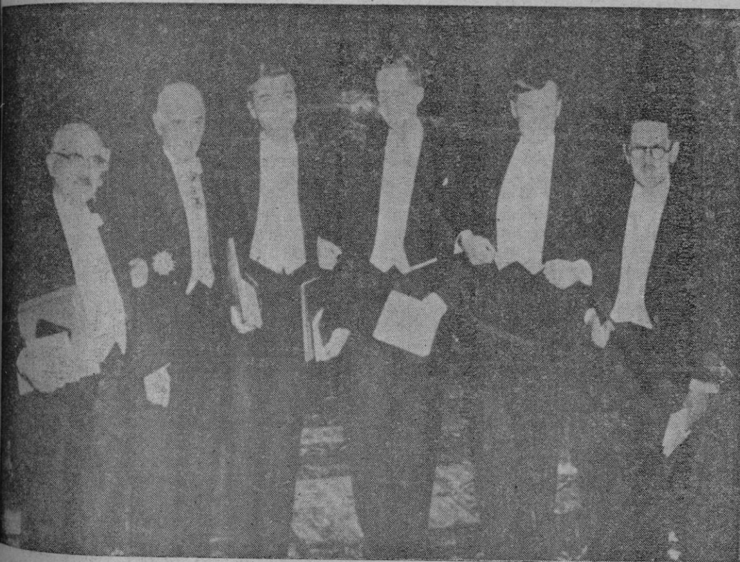
He aquí a los ganadores de los Premios Nobel de este año. De izquierda a derecha, Waksman, de Medicina; François Mauriac, de Literatura, Félix Bloch y Edward Miles, de Física, y Millington y Martín, de Química