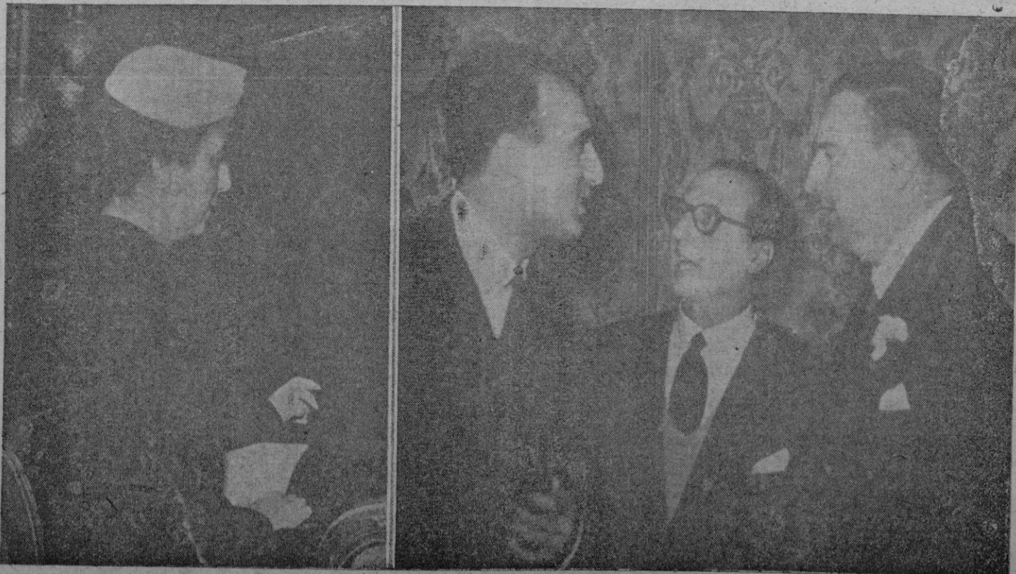
La esposa de Su Excelencia el Jefe del Estado, en el palco del teatro Calderón de Madrid, desde donde presenció, en la mañana del domingo, la función por ella patrocinada, para allegar fondos a la campaña de caridad que como todos los años organiza el gobernador civil a beneficio de los necesitados de Madrid. A la derecha, el ministro de Educación Nacional, señor Ruiz-Giménez; el de Información y Turismo, señor Arias Salgado, y el de Asuntos Exteriores, señor Martín Artajo, conversan durante uno de los intermedios del festival, que constituyó un éxito completo, tanto artística como económicamente