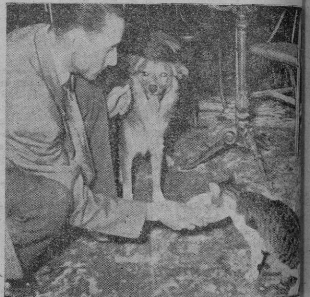
Un filantrópico caballero proporciona alimentos a los animalitos

Fueron echados a pozo seco un perro y un gato que permanecieron allí varios días, comible intervención de la Sociedad Protectora de Animales y Plantas, del cuerpo de bomberos y del vecindario