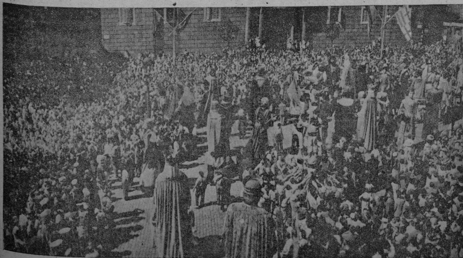
Barcelona ha celebrado con el tradicional esplendor las fiestas de su Excelsa Patrona la Virgen de la Merced. Entre los muchos números del programa destacó la gran concentración folklórica que tuvo por escenario la plaza de San Jaime y uno de cuyos aspectos se recoge en la presente fotografía