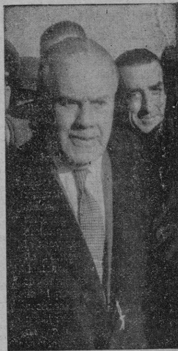
mea y Becóm, Conde de Guadalhorce, adquirió sobrado relieve por su obra en España y el ex-