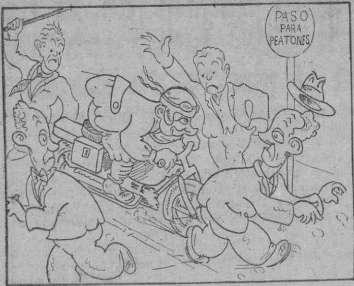
La diaria tragedia del peatón