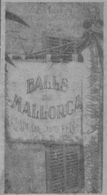
El banderín que fué bendecido en la ceremonia del domingo.