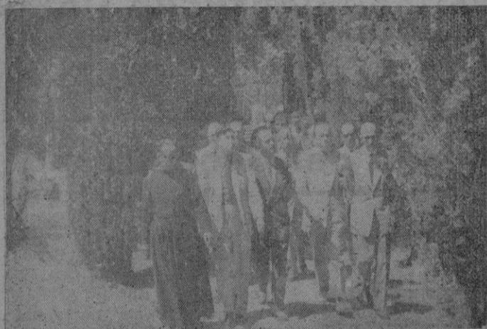
Los visitantes recorriendo los jardines de la Cartuja