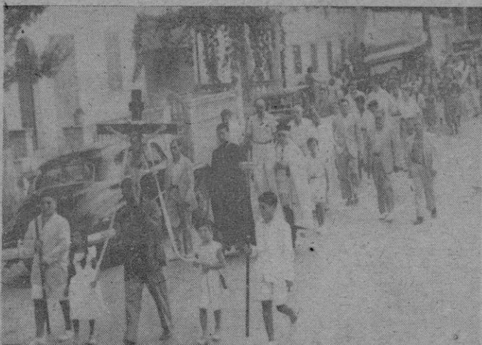
En el riente caserío de Paguera se celebraron el domingo solemnes cultos y por la tarde se celebró una procesión uno de cuyos aspectos recoge la fotografía