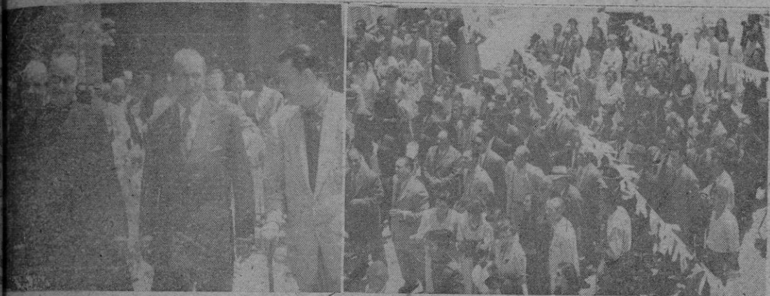
Gobernador Civil señor Rodríguez de Valcárcel a su llegada a Valldemosa. -- En la foto de la derecha el público escuchando la palabra del Excelentísimo señor Gobernador Civil