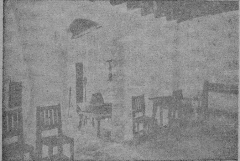
Interior de la casa natal de Fray Junipero en Petra.