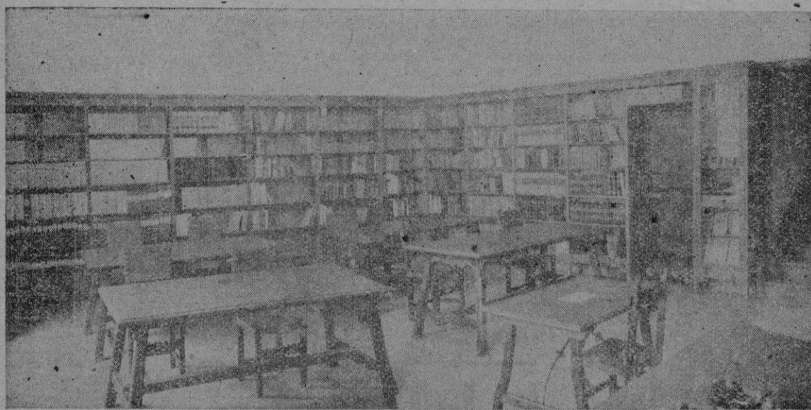
Un aspecto del Salón de la Biblioteca de Cultura Artesana que funciona en el Palacio de la Diputación Provincial

Queda por mencionar sólo la colección de revistas, de recibo corriente unas de ellas, otras, extranjeras la mayoría, de difícil logro actualmente, y algunas ya extinguidas en el campo acotado a la biblioteca. Y añadir finalmente